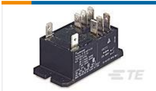
TE 产品编号1393212-8 T92S7D12-12