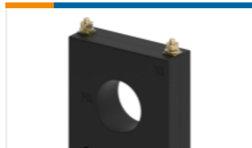
TE 产品编号CJ1147-000 CI-5SFT-501