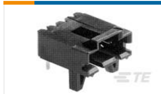
TE 产品编号103673-2 03 MTE HDR SRRA LATCH W/HLDWN