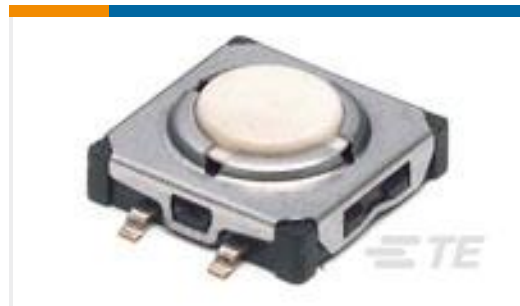
TE 产品编号1571220-2 SWITCH,TACT,12X12,SEALD,W/POST