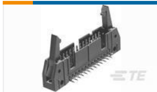
TE 产品编号102322-4 020 UNIV HDR RA 4S 30DP STD L1