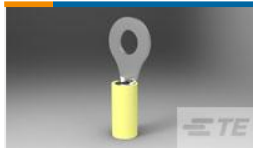
TE 产品编号165034 PIDG RING 12-10 1/4