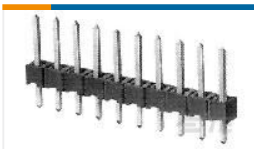
TE 产品编号1-826936-6 16P AMPMODU II STIFT LEI