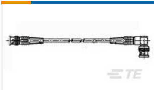
TE 产品编号1337772-4 50/OHM COAX BNC STR PLUG ELB P