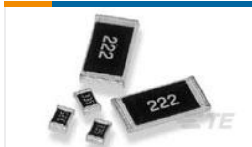
TE 产品编号1623404-1 CRG1206 1% 10K