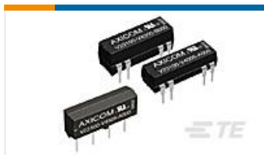
TE 产品编号1-1393763-8 V23100V4305B