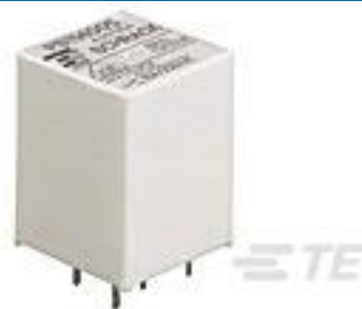
TE 产品编号 6-1415358-1 PB134009