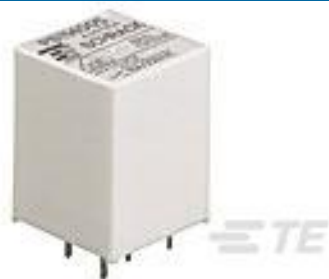
TE 产品编号 1415030-1 PB134005