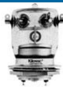
TE 产品编号 4-1618273-0 H-19/12VDC=RELAY, VACUUM, DPDT