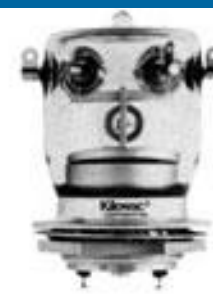
TE 产品编号 5-1618273-4 H-19C=RELAY, VACUUM, DPDT