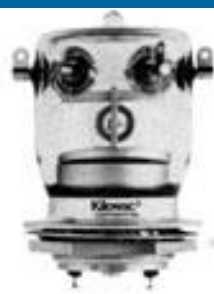
TE 产品编号 3-1618273-9 H-19/115VDC=RELAY, VACUUM, DPDT