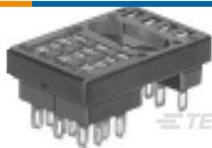
TE 产品编号 4-1393143-1 27E446=SOCKETS