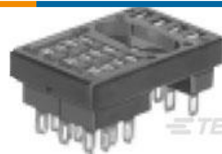
TE 产品编号 5-1393143-0 27E636=SOCKETS