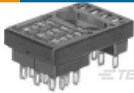
TE 产品编号 1393143-8 27E125=SOCKET,R10,10,SLG,PHE