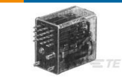
TE 产品编号 3-1393767-0 R10-E2Y2-115V=R10