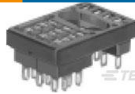
TE 产品编号 2-1393143-4 27E212=SOCKET,R10,10,PC,PHEN