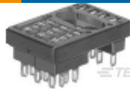
TE 产品编号 3-1393143-4 27E317=SOCKETS