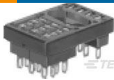
TE 产品编号 2-1393143-1 27E193=SOCKET,R10,11,PC,PHEN