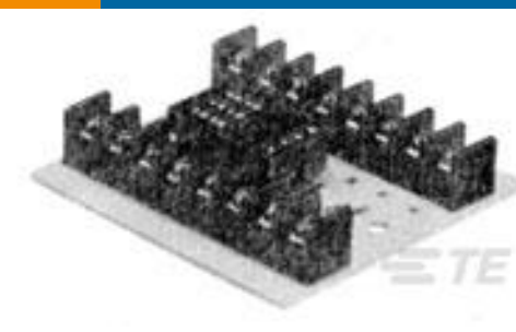
TE 产品编号 1393837-1 27E460=SOCKET,R10,,ASSY,2 POLE