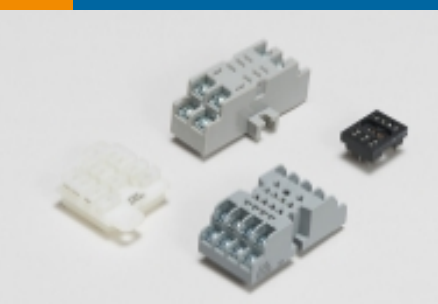
继电器附件、插座和卡箍(34)