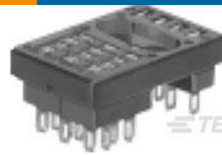
TE 产品编号 3-1393143-6 27E342=SOCKETS