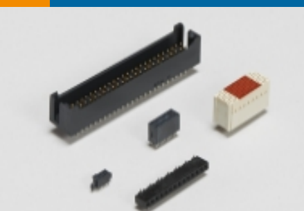
板对板接头和插座(1)