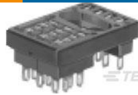
TE 产品编号 1-1393143-1 27E128=SOCKET,R10,10,PC,PHEN