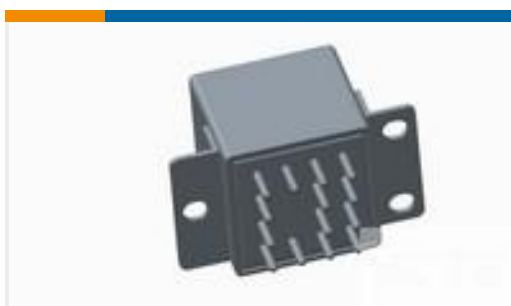
TE 产品编号2-1617805-4 TD228-3002P=TDFO 30 SEC M83726 /28-3002P