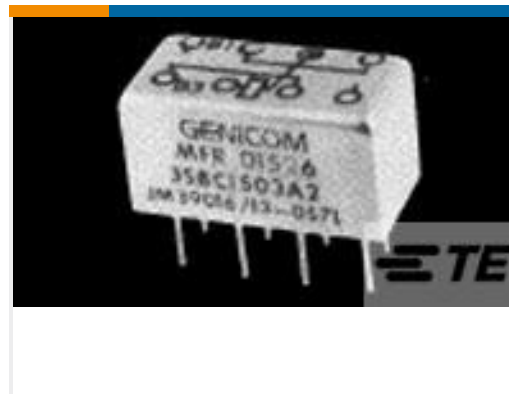
TE 产品编号1617354-3 3SBC1512A2=M39016/13-066L