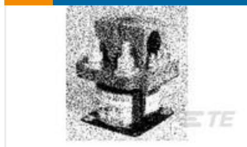
TE 产品编号1616055-2 A1077D=RELAY