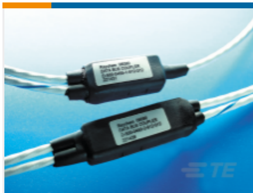
TE 产品编号177301-000 D-500-0255-240-1