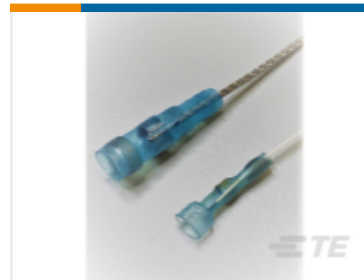
TE 产品编号372141-000 D-183-0037