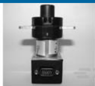
TE 产品编号 5-1616986-8 K4001B8C2=CONTACTOR SPST NO DB 400 AMP