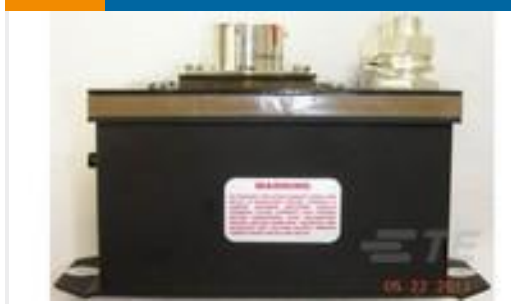
TE 产品编号4-1616058-4 A770WF=RELAY