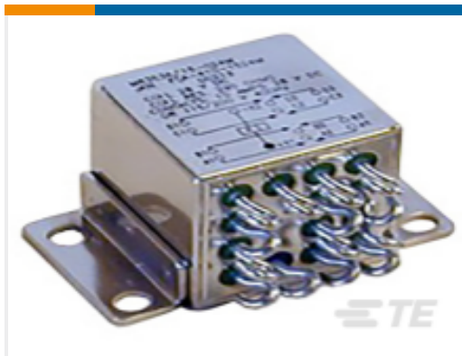
TE 产品编号1617754-8 FCA-410-1602M=M83536/16-002M