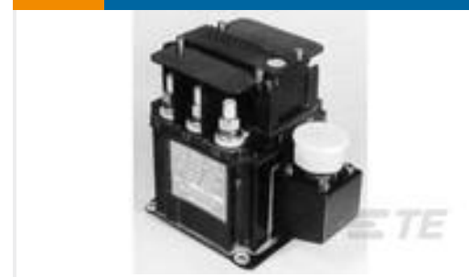
TE 产品编号1616081-4 A1077W=RELAY