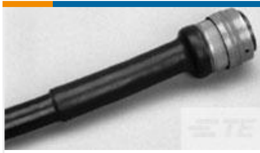
TE 产品编号6886964011 ATUM-9/3-X-SP