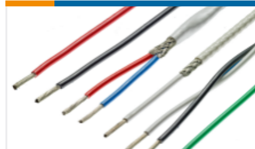
TE 产品编号2839323002 44A0111-28-45