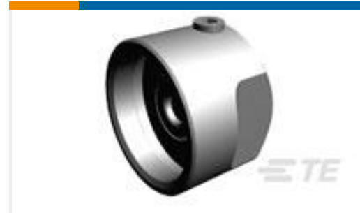
TE 产品编号1918934-4 STD CABLE ADAPTER, NO BOOT, HA, 5.5 mm