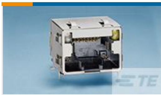
TE 产品编号2178126-1 Jack, CLOUDSPLITTER SMT SHIELDED