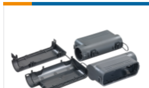
TE 产品编号1-2500034-6 SRC Female Conduit Cover