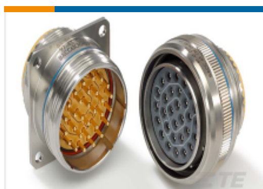
TE 产品编号ZPF000000000008723 983-6SE 08-03 SN-A1208