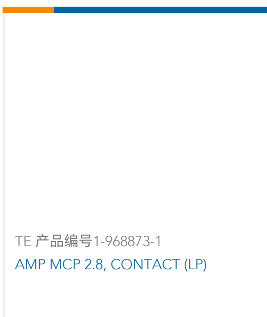
TE 产品编号1-968873-1 AMP MCP 2.8, CONTACT (LP)