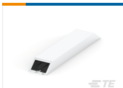
TE 产品编号2176299-5 CJN 500W 22R 5% LEAD