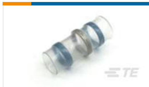
TE 产品编号114163-000 CWT-9003