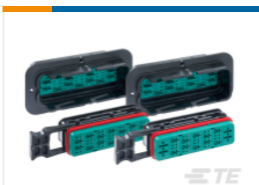
TE 产品编号2500025-1 SRC2 84 Pin Male Blade Hsg Assy 2.5