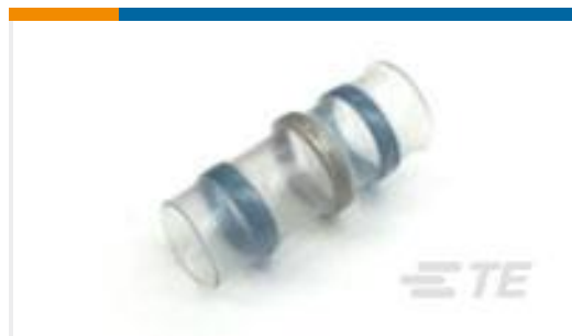
TE 产品编号054955-000 CWT-9001