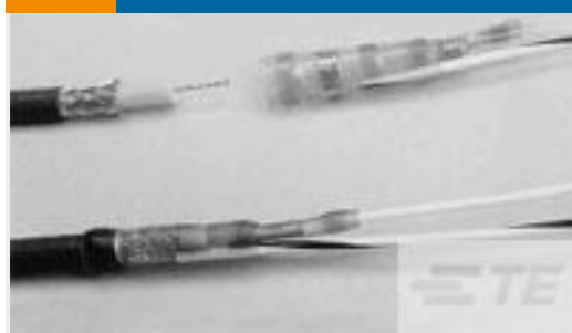
TE 产品编号179544-000 D-181-2222-90/9