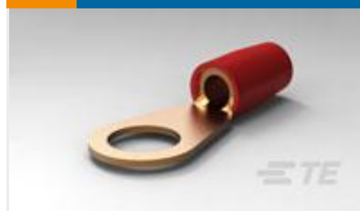
TE 产品编号324045 TERMINAL,T-N R 8 3/8