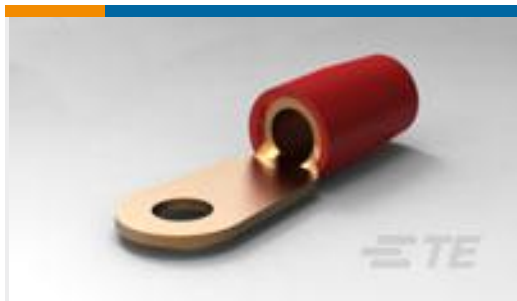
TE 产品编号324043 TERMINAL,T-N R 8 10