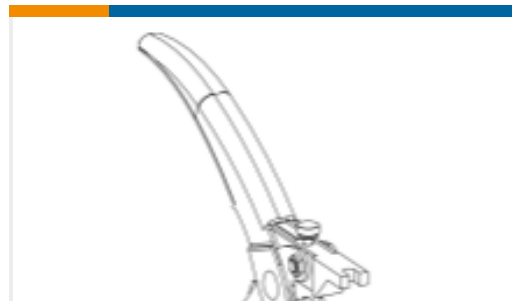
TE 产品编号1976593-1 TOOL, INS, GB QUADRAX SOCKET