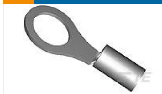
TE 产品编号323171 TERMINAL,SOLIS R HR 6 5/16