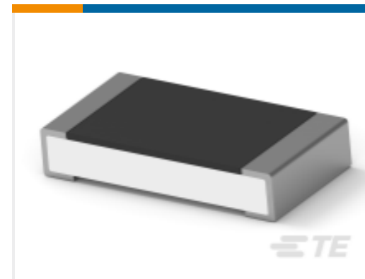
TE 产品编号2-2176391-1 RQ 1206 20K 0.1% 10PPM 5K RL