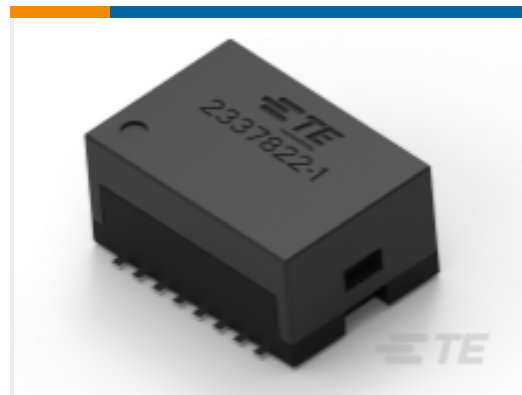
TE 产品编号2337822-1 DISCR.ETH.MAG. 10/100 SINGLE SMT