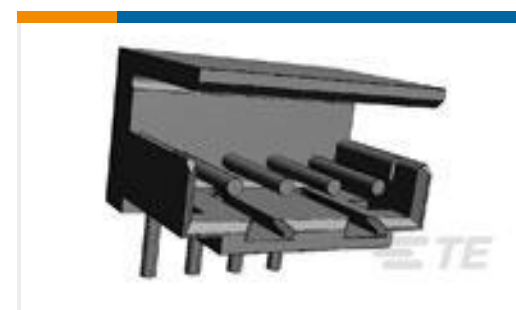
TE 产品编号176394-2 CT BOX HDR ASSY H 2P GOLD