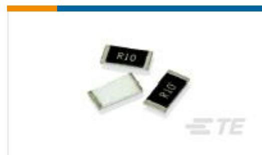
TE 产品编号2-2176050-5 RLP73K 1E R51 5% 5K RL