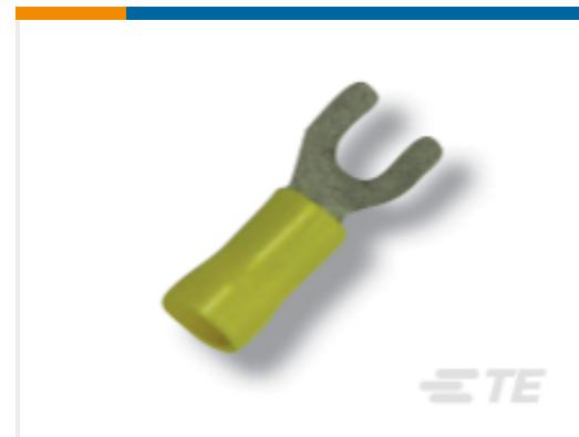
TE 产品编号BM3041-000 CPGI-B-106-2503/1503-5