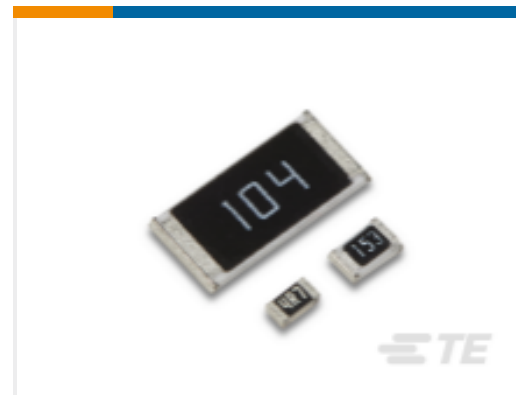
TE 产品编号3-2176347-7 CRGCQ 2010 10K 1%