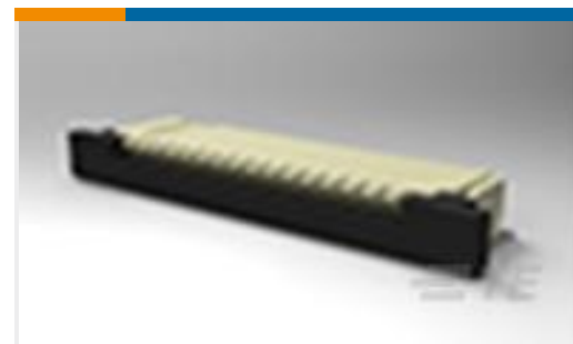
TE 产品编号2-84953-9 1MM FPC HORZ.TOP CONT.ASSY 29P