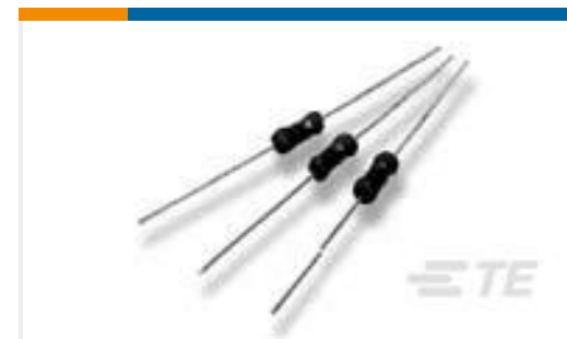
TE 产品编号1879350-5 RR01 5% R33 AMMO