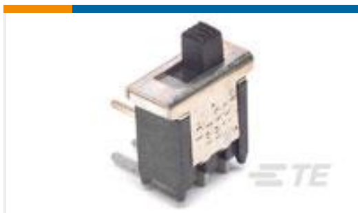
TE 产品编号1571982-7 TSS21NGPC04=SLIDE SWITCH DPDT