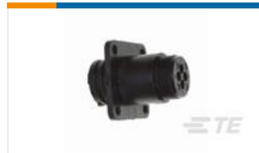
TE 产品编号206061-1 RECPT, SZ 11-4, CPC