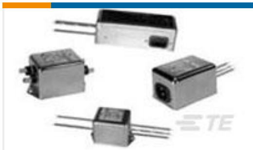
TE 产品编号6609048-9 20EQ1 M0=F7776