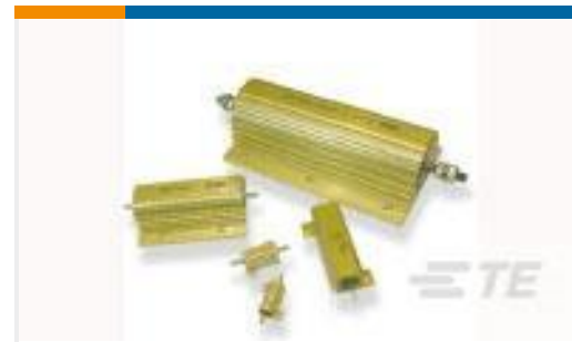
TE 产品编号2-1630027-4 HSC300 R47 5%