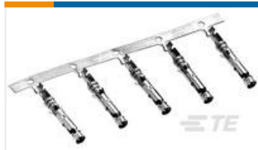
TE 产品编号1-66100-9 III+ SKT,18-16,TIN ,STRIP