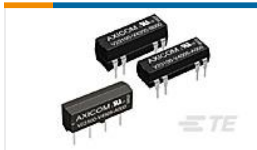
TE 产品编号1-1393763-2 V23100V4015A 10