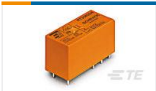
TE 产品编号1-1393238-9 RTB14024