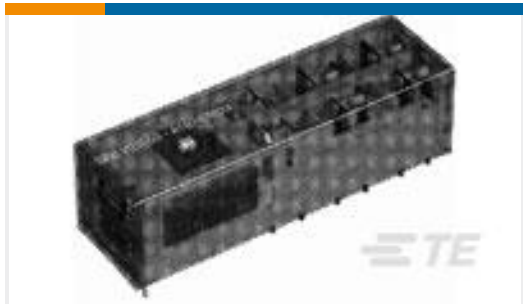
TE 产品编号1393260-7 SR6B4024 - V23050-A1024-A542