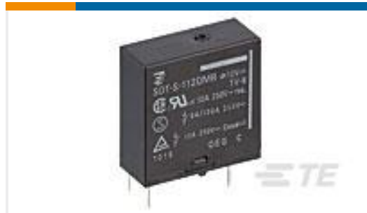
TE 产品编号9-1419125-9 SDT-S-112LMR,000