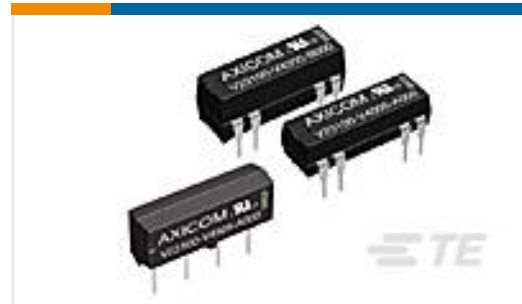
TE 产品编号1-1393763-0 V23100V4015A000