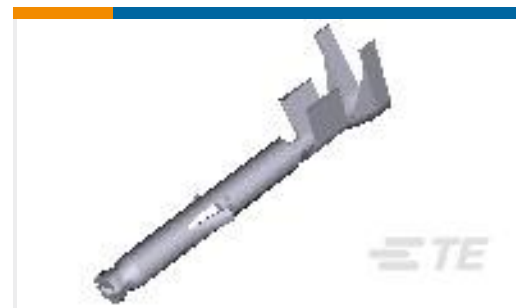
TE 产品编号1-770988-1 MINI UMNL SOK 22-18AWG LP LF