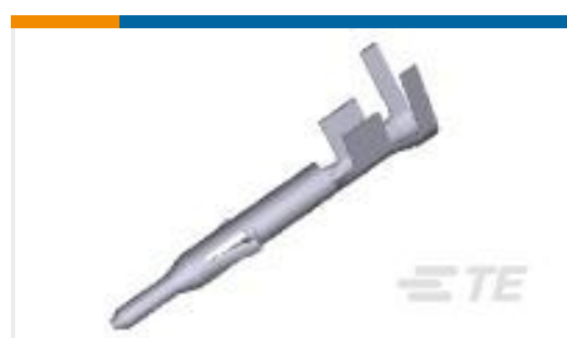
TE 产品编号1-770987-0 MINI UMNL PIN 22-18 AWG AU LP