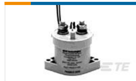
TE 产品编号1618002-7 EV200AAANA=RELAY, EV200 SPST-N