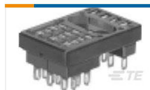
TE 产品编号1-1393143-3 27E130=SOCKET,R10,22,PC,PHEN