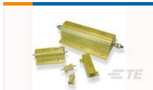
TE 产品编号1-1630012-9 HSC150 2R2 5%