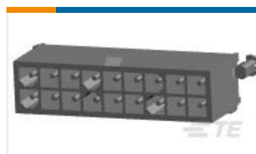
TE 产品编号1-794069-0 18P MINI UMNL HDR W/DH SN LF