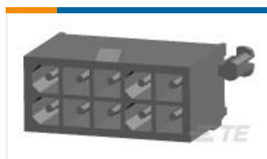
TE 产品编号1-770743-1 10P MINI UMNL HDR ASSY VRT LF