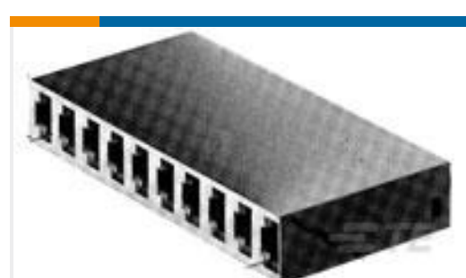
TE 产品编号1-87159-4 15 MODI CRMP S-I HSG SR .156CL