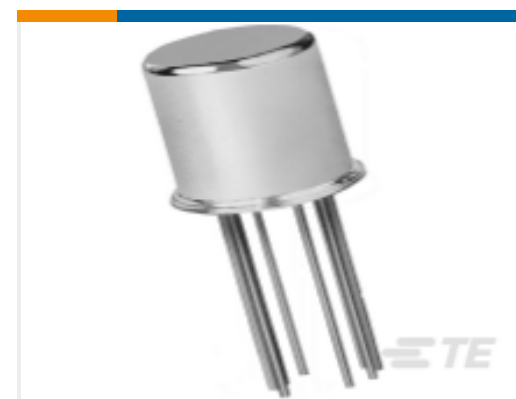
TE 产品编号1617120-4 J1MSW-26XL = M39016/10-023L