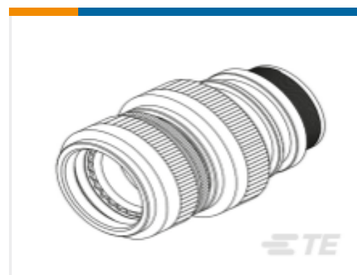
TE 产品编号A76929-000 STXR40AB00-2422AI