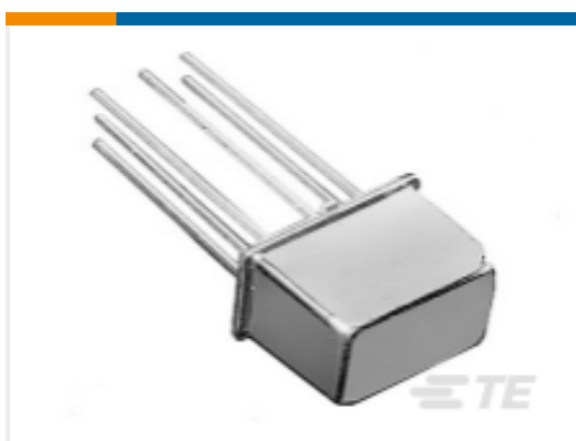
TE 产品编号1617152-3 JMGSPD-12P = M39016/42-043P