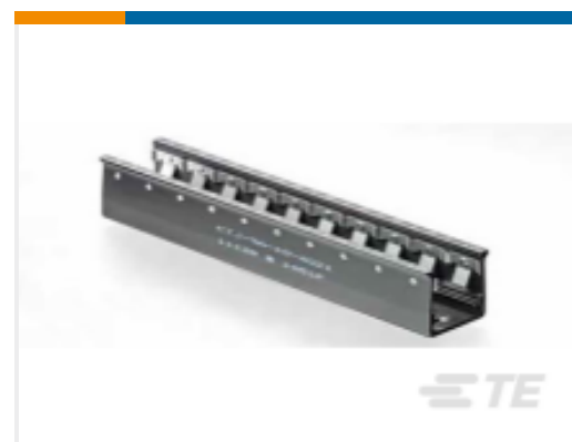
TE 产品编号CTJ-3D-09 RAIL ASSY