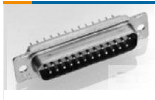
TE 产品编号1-1757824-2 AMPLIMITE,ASY,RCPT,STD,90,ZN,6,CONT