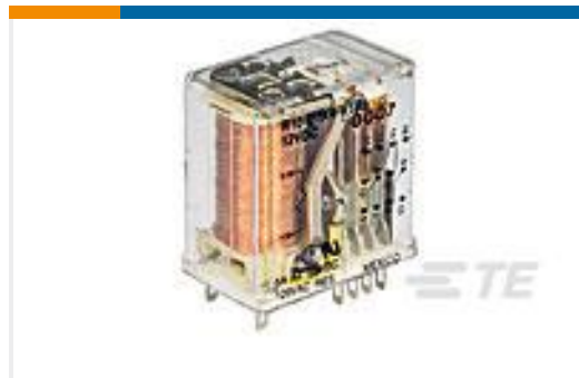
TE 产品编号1393766-9 R10-E1X2-V700=R10