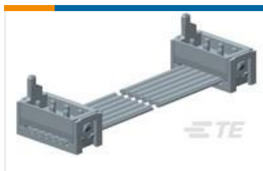
TE 产品编号1483351-1 MICRO-MATCH LEAD 06P 100MM