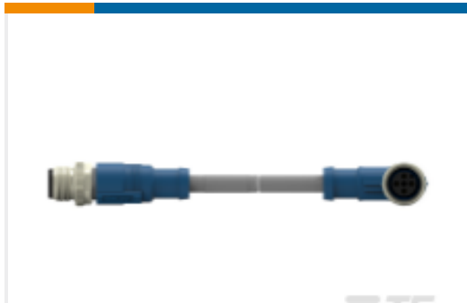
TE 产品编号T4162124004-005 RPC-M12-4MS-5.0SH-M12-4FR-PUR