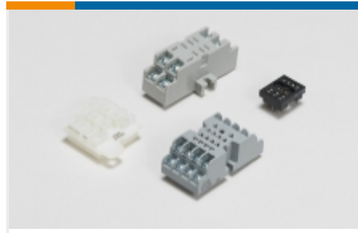
继电器附件、插座和卡箍(34)