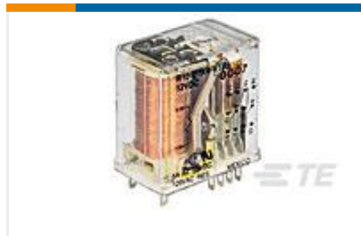
TE 产品编号1-1393766-7 R10-E1X4-V700=R10