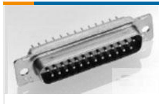
TE 产品编号1-1757824-1 AMPLIMITE,ASY,RCPT,STD,90,ZN,5,CT