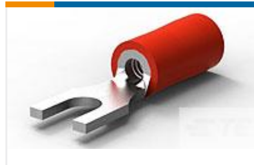
TE 产品编号165004 PLASTI-GRIP, SPADE 22-16 4