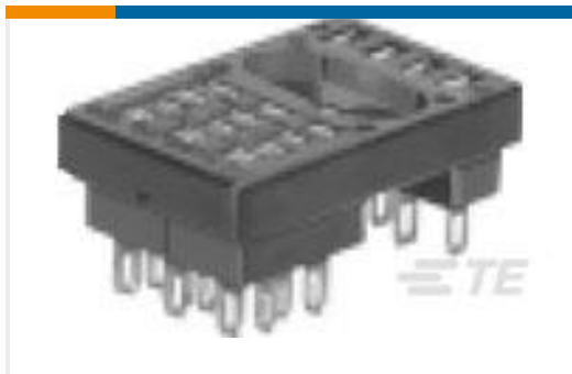
TE 产品编号1-1393143-1 27E128=SOCKET,R10,10,PC,PHEN