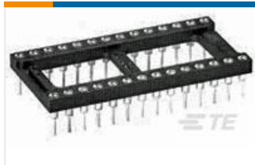
TE 产品编号1437537-5 808-AG10D=SOCKET ASSY