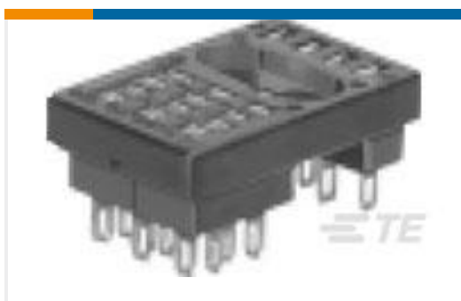
TE 产品编号1-1393143-3 27E130=SOCKET,R10,22,PC,PHEN