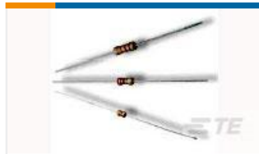
TE 产品编号1623927-4 CFR16 5% 10K