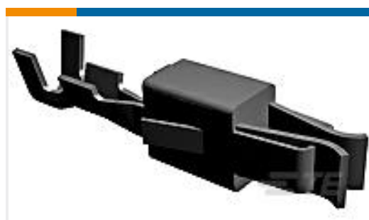
TE 产品编号927781-3 JPT REC 2.8 Contact SRC Sn (LP)