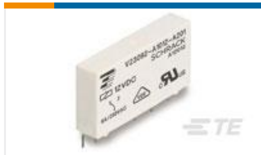
TE 产品编号1393236-2 V23092-A1005-A301