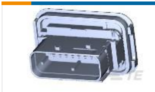
TE 产品编号1-1564532-1 15POS, MIXED,TAB HSG,ASSY