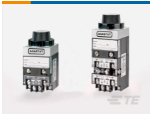
TE 产品编号1423158-3 7012L10DLN=AGASTAT TIMING RELA