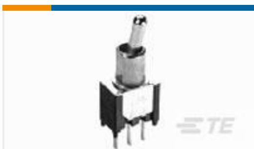
TE 产品编号9-1437562-8 TTE13E8T1/4=SW TOGGLE WATERTIG