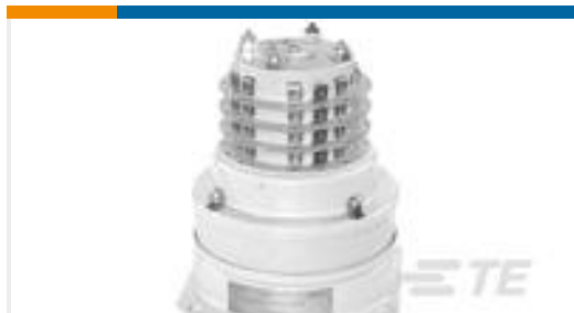
TE 产品编号1-1393139-9 MDR-170-2=MDR