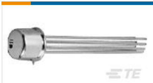
TE 产品编号1617162-9 J1MACT-26XPS = M28776/5-036P