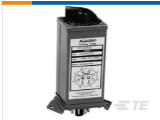
TE 产品编号1-1423153-1 2122AH39DF=RLY,MINI,OFF,2P,24V