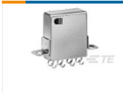
TE 产品编号1617014-3 3SAT1303A2 = M5757/13-086