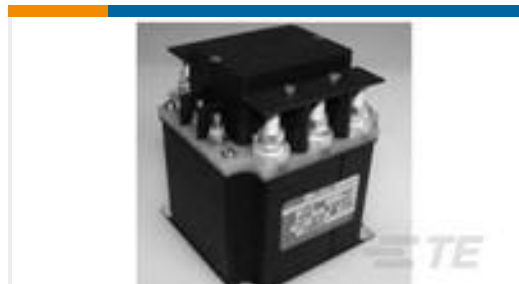
TE 产品编号1616021-6 SA136A=CONTACTOR 3PST N.O. 75