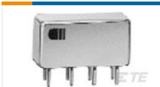
TE 产品编号1617024-6 HF1201A00 = HF 1/2 SIZE RELAY