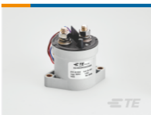
TE 产品编号1618408-5 KCS03X024EAAA=CONTACTOR, CURRENT SENSE