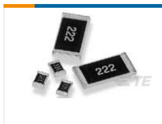
TE 产品编号 1623157-1 CRG0805 1% 22K