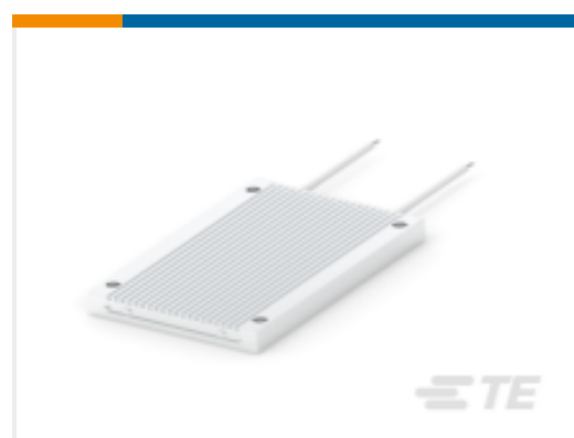
TE 产品编号1-2176250-1 TJT 500W 47R 5%