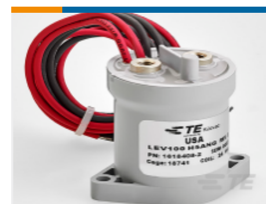
TE 产品编号1618408-2 LEV100H5CNG = CONTACTOR WITH AUX SPST