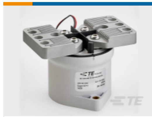
TE 产品编号 7-1618413-0 K1K06H024EAFA=CONTACTOR SPST-NO W/AUX