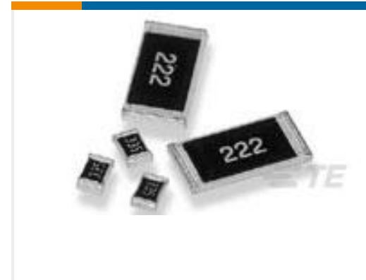
TE 产品编号1623131-1 CRG0805 1% 1K0