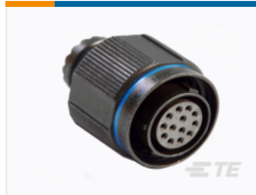
TE 产品编号YDTS26F25-37PCV001 PLUG ASSY