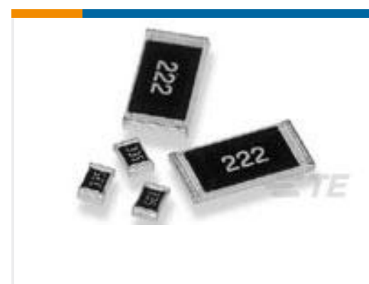
TE 产品编号1623181-1 CRG0805 1% 2K7