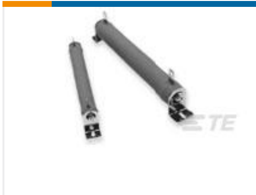
TE 产品编号1-1879453-9 TE 1000W 33R 5% Bracket