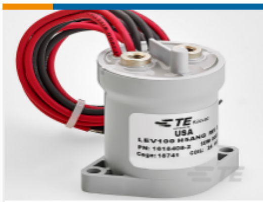
TE 产品编号 1618408-2 LEV100H5CNG = CONTACTOR WITH AUX SPST