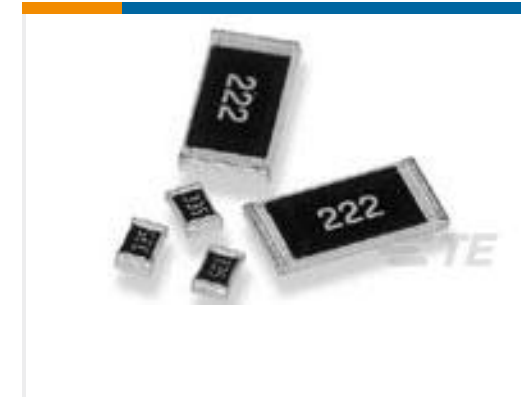
TE 产品编号1623096-1 CRG0805 1% 100R