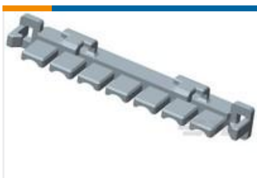
TE 产品编号1-1969609-1 11P VAL-U-LOK TPA 26-22 AWG