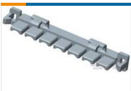
TE 产品编号1-1969609-2 12P VAL-U-LOK TPA 26-22 AWG