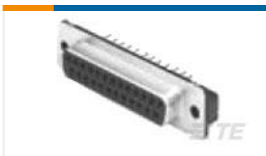
TE 产品编号1-747299-6 15 RCPT SP/FMS SCRLK