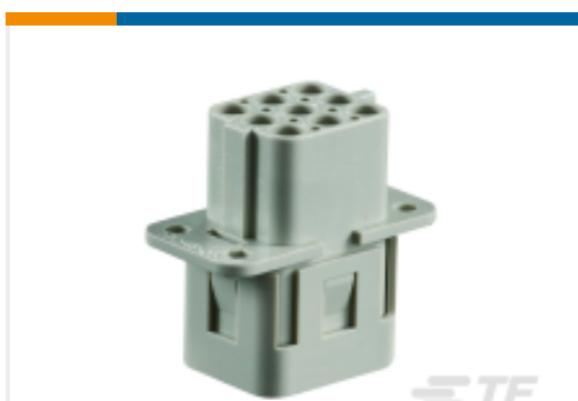
TE 产品编号T2019092201-000 HQ-008-F