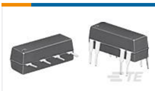
TE 产品编号2-1393771-0 JWD-171-5=REED RELAYS