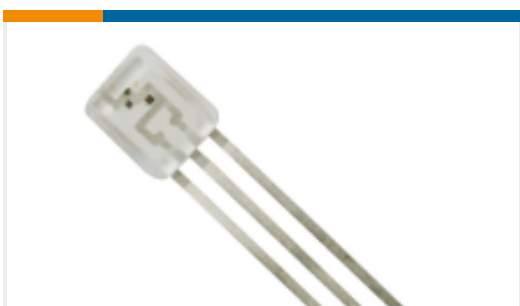
TE 产品编号11032254-00 EMITTER 660/940NM 1 2