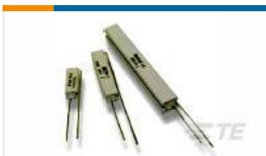
TE 产品编号1-1623728-7 BCHE 11 W 33R 5%