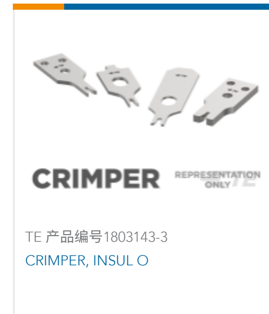
TE 产品编号1803143-3 CRIMPER, INSUL O