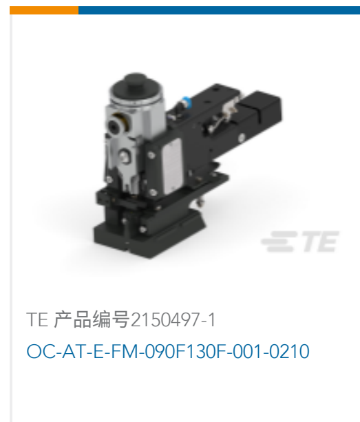
TE 产品编号2150497-1 OC-AT-E-FM-090F130F-001-0210