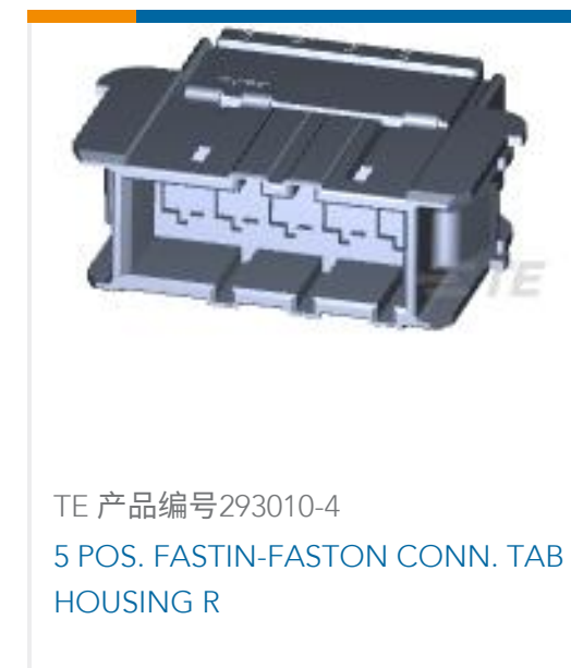
TE 产品编号293010-4 5 POS. FASTIN-FASTON CONN. TAB HOUSING R