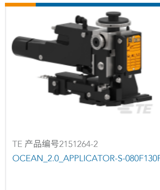
TE 产品编号2151264-2 OCEAN_2_0_APPLICATOR-S-080F130F