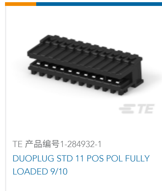
TE 产品编号1-284932-1 DUOPLUG STD 11 POS POL FULLY LOADED 9/10