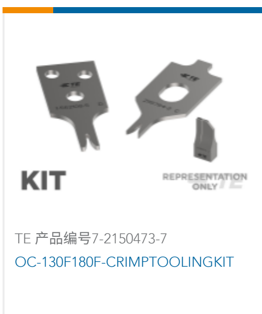
TE 产品编号7-2150473-7 OC-130F180F-CRIMPTOOLINGKIT