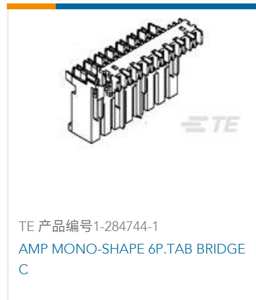
TE 产品编号1-284744-1 AMP MONO-SHAPE 6P.TAB BRIDGE C