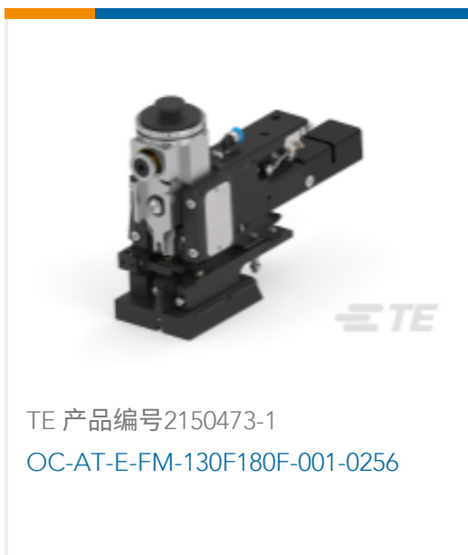
TE 产品编号2150473-1 OC-AT-E-FM-130F180F-001-0256