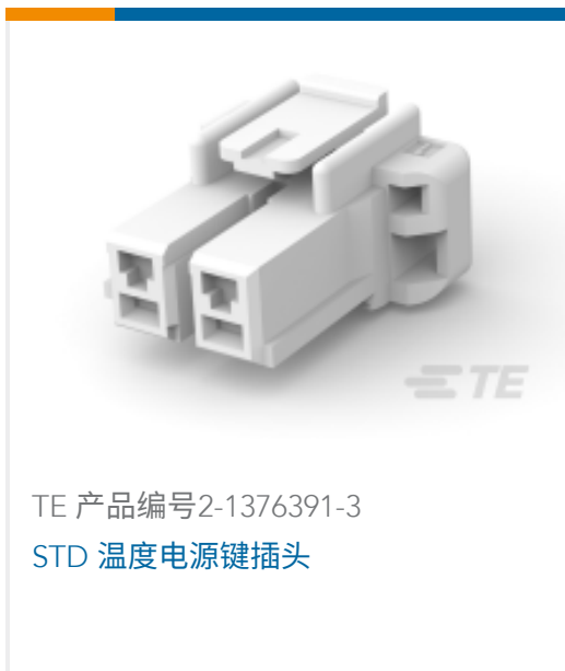
TE 产品编号2-1376391-3 STD 温度电源键插头