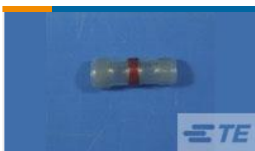
TE 产品编号359539-000 D-108-10CS948