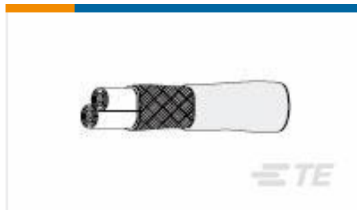
TE 产品编号306040-001 44AM1121-20-0/2-9