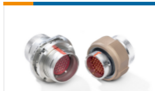
TE 产品编号ZPF000000000099828 901-21 RT 2-37-0 SN