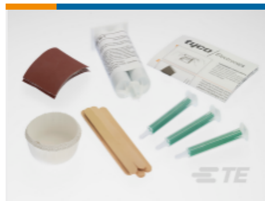
TE 产品编号 657863-000 S1125-KIT-8