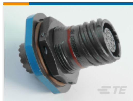
TE 产品编号YDTS24W17-06PAC001 RECP ASSY