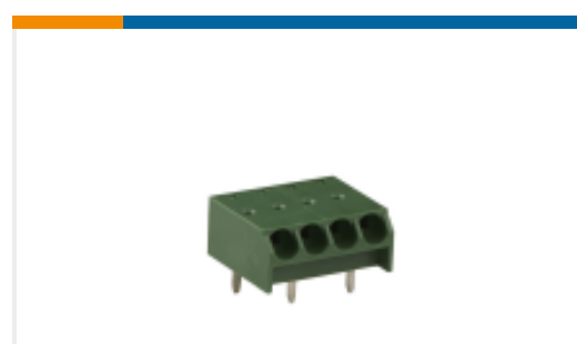
TE 产品编号1-2834019-2 2POS 3.5MM THTS CONN.