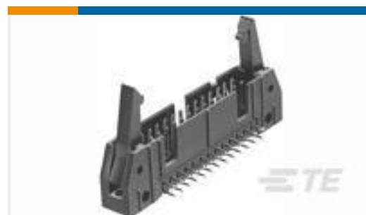
TE 产品编号1-499786-2 064 UNIV HDR RA 4S 15DP STD L1