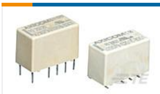
TE 产品编号1-1393788-1 V23079A1003B301