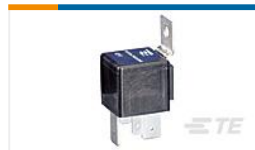
TE 产品编号1-1414286-0 V23134J0052X439-EV-CBOX