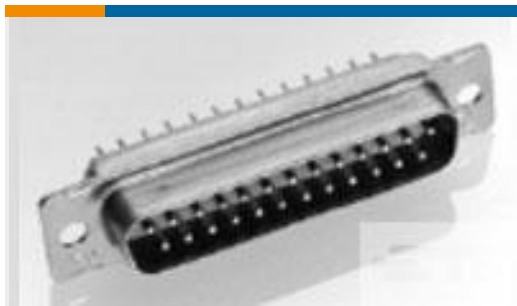
TE 产品编号 205164-6 AMPLIMITE,ASY,PLUG,109,2