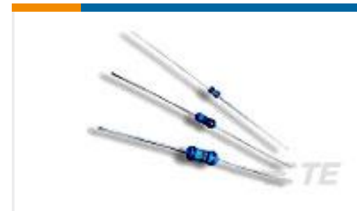
TE 产品编号 1622730-1 LR2 1% 30K