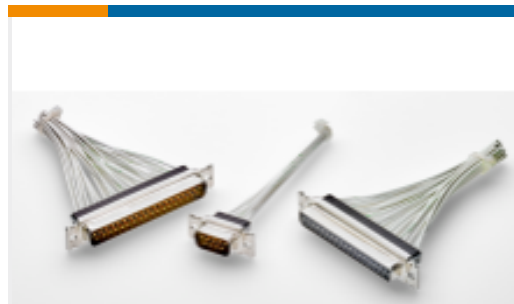
TE 产品编号 2335889-1 AMPLIMITE SZ 1 PLUG. 9 POS, ST STL SHELL