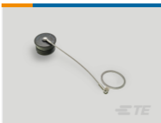
TE 产品编号 YDTS32F25NV0010000 DUST COVER ASSEM