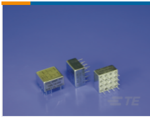
TE 产品编号 1-1617076-5 3SBH1148A2 = M39016/14-006M