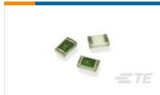
TE 产品编号 3-2176090-1 RP 1J 0.166W 267K 0.1% 25PPM 1K RL