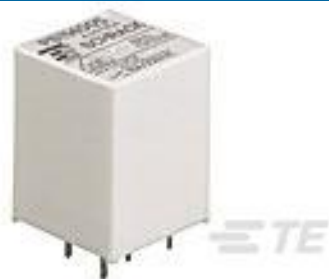
TE 产品编号 2-1415356-1 PBH34012