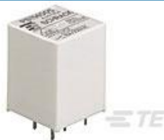
TE 产品编号 9-1415357-1 PBH34022