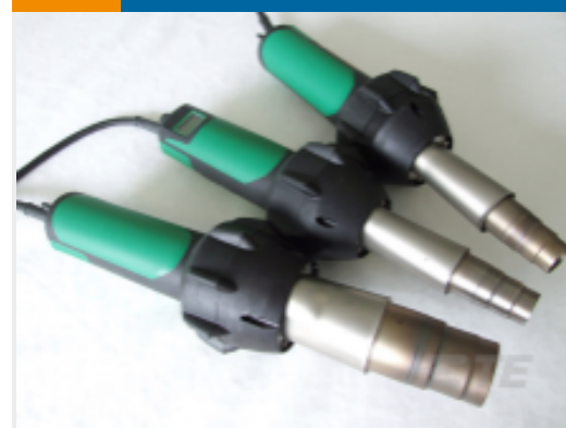
TE 产品编号 EG1114-000 CV1981-ST-230V1600W-EU