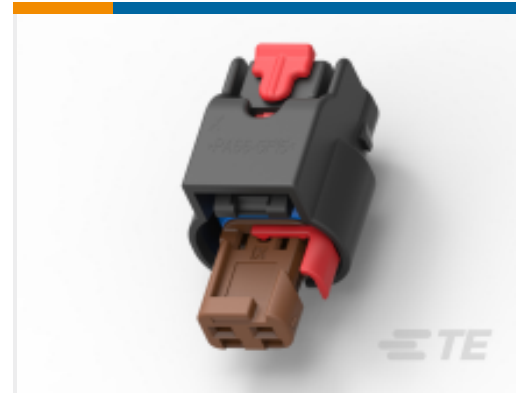
TE 产品编号 2098557-4 2POS, MCON 1.2 CB REC 2p TL SEALED