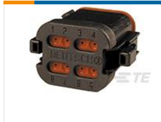
TE 产品编号 DT06-08SB-CE05 PLG, 8P, BLK, E, SEAL RET, CAP, B