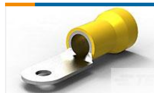
TE 产品编号 52043-4 TERMINAL R PG 4 10