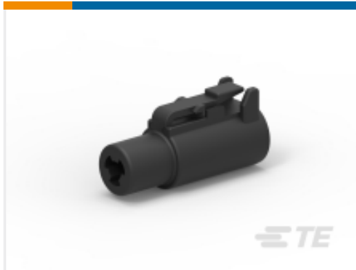
TE 产品编号 DTHD06-1-12S-E003 PLG, 1P, BLK, N, SIZE 12, CAP