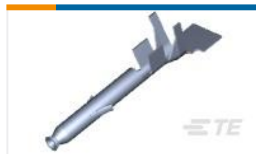
TE 产品编号 770904-6 MINI UMNL SOK CONT 22-18AWG AU