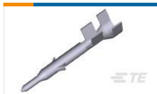
TE 产品编号 794406-3 MINI UMNL CONT 20-16AWG AU