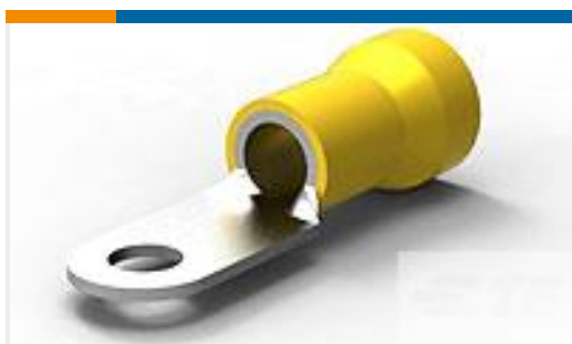
TE 产品编号 52043-7 TERMINAL R PG 4 1/4