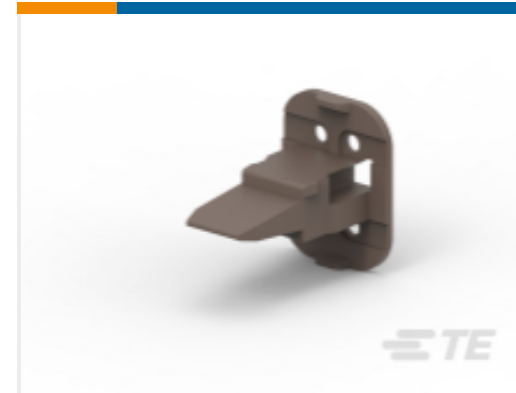
TE 产品编号 W4SD-P012 WEDGE LOCK, 4P, PLG, BRN, SL RET, DT, D