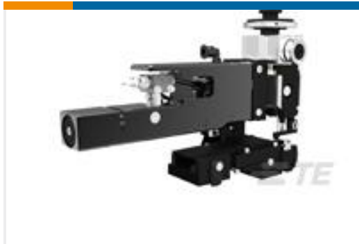
TE 产品编号2151951-2 OCEAN_2.0_APPLICATOR-S-157F244OV