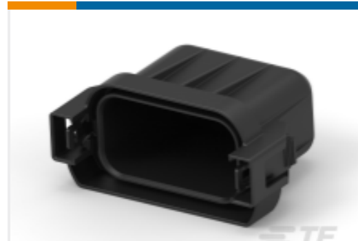
TE 产品编号2319021-2 REC CONN CVR,8POS,AMP MCP 2.8, FRB