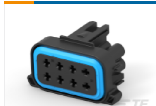
TE 产品编号2319023-2 8POS,AMP MCP 2.8,REC HSG ASSY, SLD