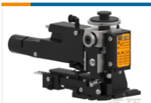
TE 产品编号2836931-2 OCEAN_2.0-Applicator-S-087F110O