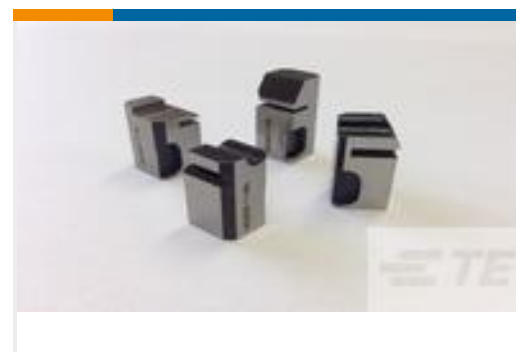
TE 产品编号318059-2 FLOATING SHEAR