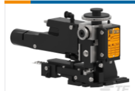
TE 产品编号2836810-2 OCEAN-2.0-APPLICATOR-S-059F070OA