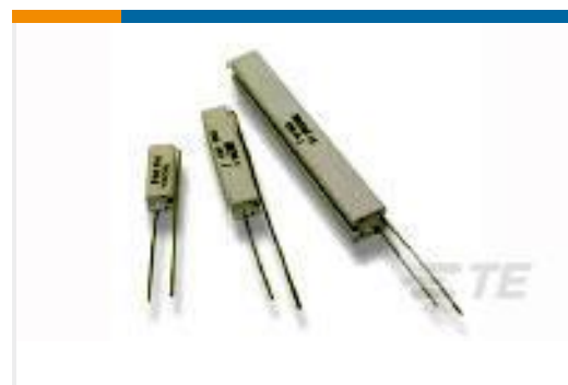
TE 产品编号2176205-1 SBCV8 47R 5%