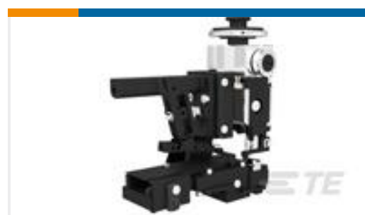
TE 产品编号2266316-1 OC-AT-S-FM-070F100F-059-0592