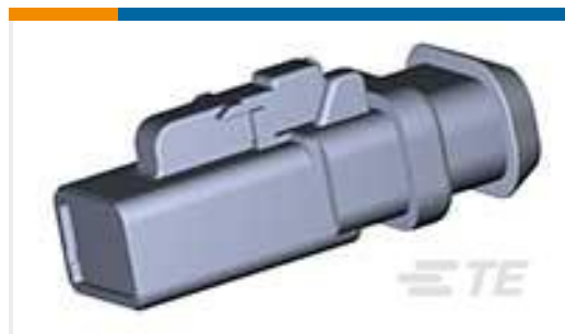
TE 产品编号DTP06-2S-CE09 PLG, 2P, BLK, E, XCAP