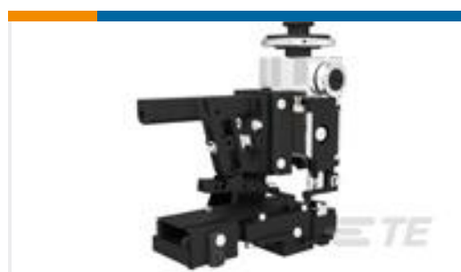
TE 产品编号2151267-1 OCEAN_2.0_APPLICATOR-S-080F100O