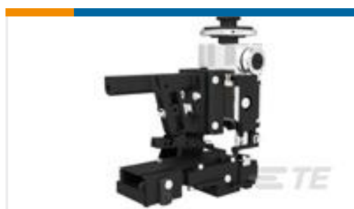
TE 产品编号2151184-1 OCEAN_2.0_APPLICATOR-S-062F070BX