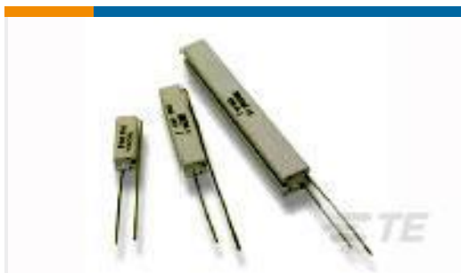
TE 产品编号1-1623732-9 BCHE 7 W 1R5 10%