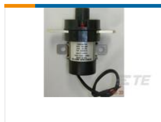
TE 产品编号 2-1616980-5 K200A1C1=CONTACTOR 200 AMP SPST 28 VDC