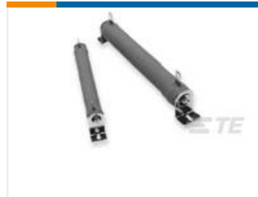
TE 产品编号3-1879447-2 TE 200W 390R 5% Bracket