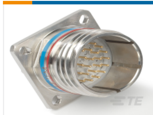
TE 产品编号YDTS20Z25-29PNV001 RECP ASSY