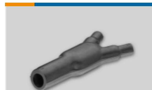
TE 产品编号163549-000 382A034-25/42-0