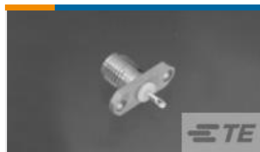
TE 产品编号1052928-1 2052 8003 92