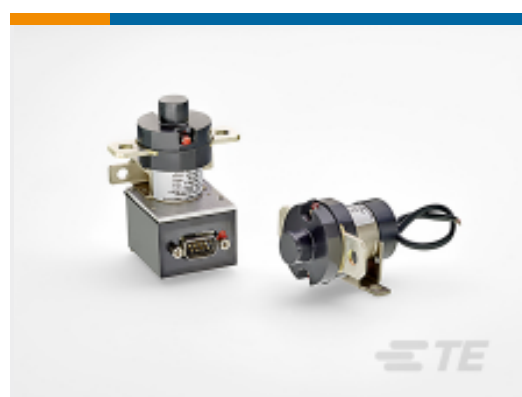
TE 产品编号 8-1616977-1 K200A3C=CONTACTOR SPST DB 200 AMPS