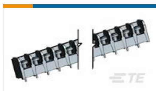
TE 产品编号4-1437658-0 8PCV-11-006=8PCV