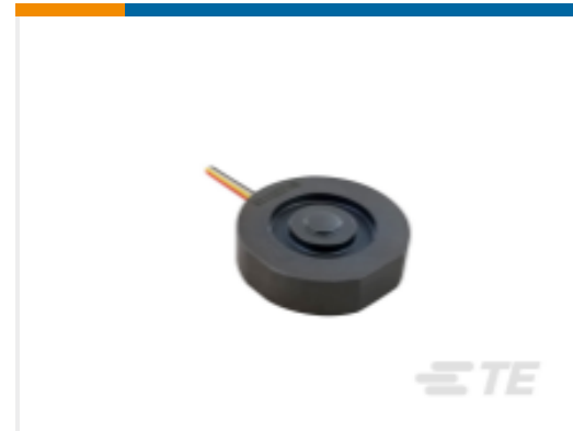
TE 产品编号20009605-09 FX293X-040B-0025-L