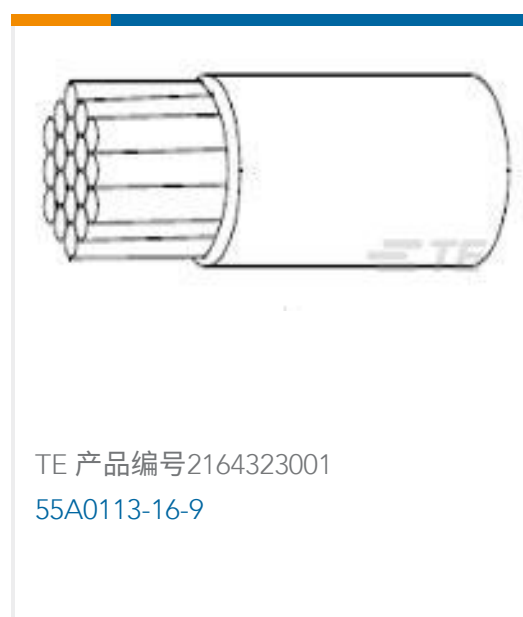
TE 产品编号2164323001 55A0113-16-9