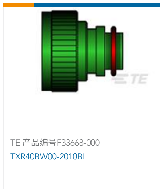
TE 产品编号F33668-000 TXR40BW00-2010BI