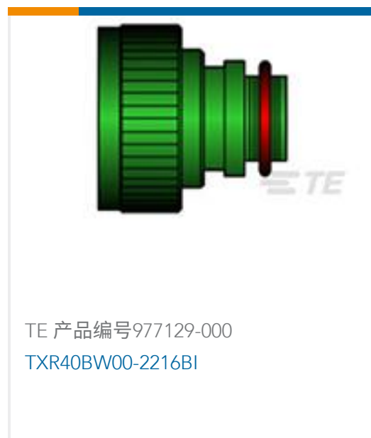
TE 产品编号977129-000 TXR40BW00-2216BI