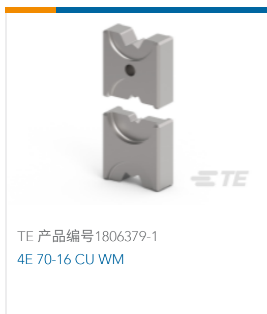
TE 产品编号1806379-1 4E 70-16 CU WM