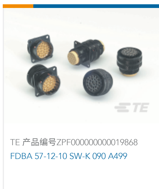
TE 产品编号ZPF00000000019868 FDBA 57-12-10 SW-K 090 A499