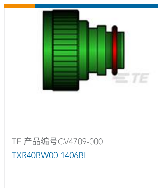
TE 产品编号CV4709-000 TXR40BW00-1406BI