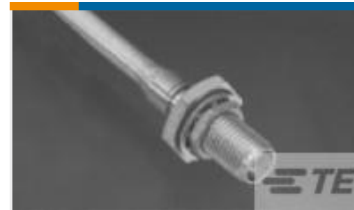
TE 产品编号1051984-1 SMA BULKHEAD JACK 2034 8009 90