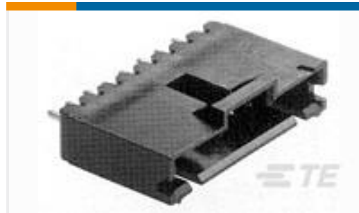
TE 产品编号104362-7 08 MTE HDR SRST LATCH W/HLDWN