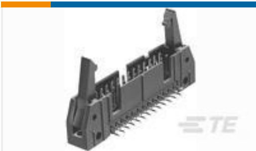
TE 产品编号3-5499345-0 A/L UNIV HDR 50P RA SHT LAT BLUE