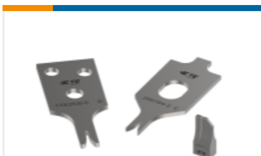
TE 产品编号 7-2836422-7 OCEAN_2.0_SPARE_PART_KIT- 062F0700