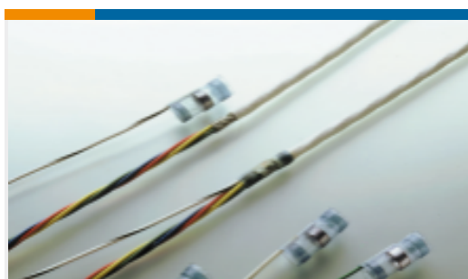
TE 产品编号 626702N001 S02-20-R-6CS1093