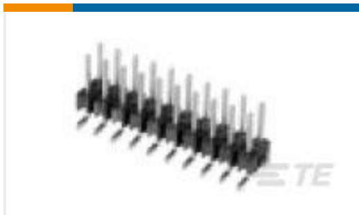
TE 产品编号 147279-4 04 MODII HDR DR SFMT B/A T&R