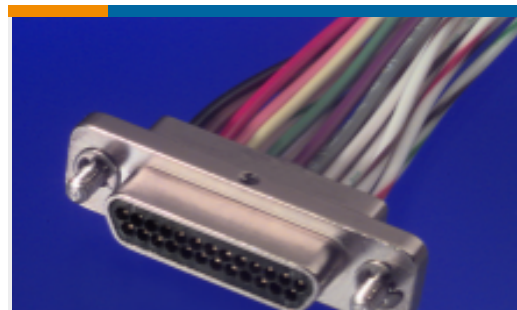
TE 产品编号 2-1532172-7 M83513/04-B11C, MCKS-C2-B- 15S6Q9-18.0