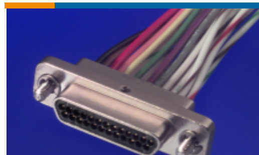
TE 产品编号 2-1532176-7 M83513/04-F11C, MCKS-C2-B-37S6Q9- 18.0