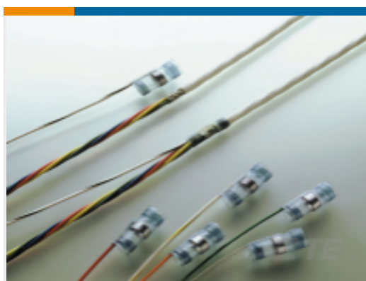
TE 产品编号367417N001 S02-18-R-90CS1092