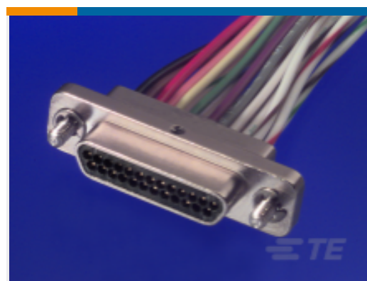
TE 产品编号2-1532176-7 M83513/04-F11C, MCKS-C2-B-37S6Q9-18.0