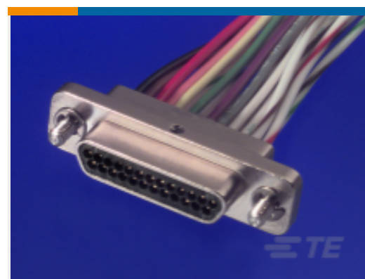
TE 产品编号2-1532172-7 M83513/04-B11C, MCKS-C2-B-15S6Q9-18.0