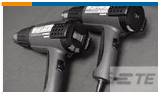
TE 产品编号 CJ2087-000 HL2010E-KIT-120V