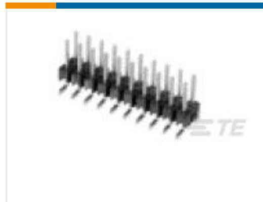
TE 产品编号147279-4 04 MODII HDR DR SFMT B/A T&R