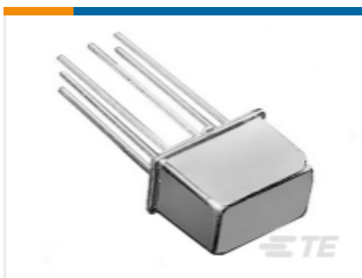
TE 产品编号1617152-3 JMGSPD-12P = M39016/42-043P