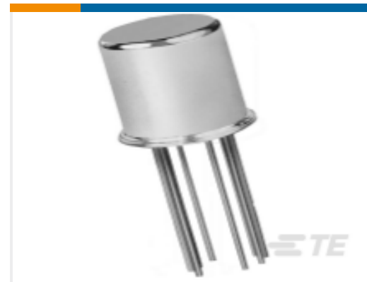
TE 产品编号1617120-4 J1MSW-26XL = M39016/10-023L