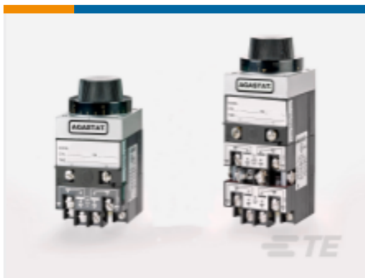
TE 产品编号 1-1423169-0 E7012PD004=RLY,NUC,ON,2P,125VD