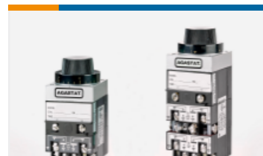
TE 产品编号1755170-1 7022OCIM=RLY,STD,OFF,2P,24V,15S,I, M