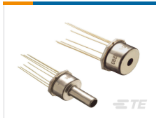
TE 产品编号47-030A 30PSIA BOARD MOUNT PRESSURE SENSOR