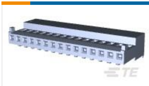
TE 产品编号4-644038-5 15P MTA100 CONN ASSY POL 15AU