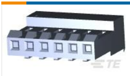
TE 产品编号3-641219-6 06P MTA156 CONN ASSY 22AWG LF