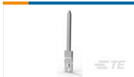
TE 产品编号1601215-2 TAB, .059 X .032, STD SMZ