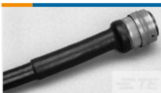
TE 产品编号4177512003 ATUM-24/6-0-STK