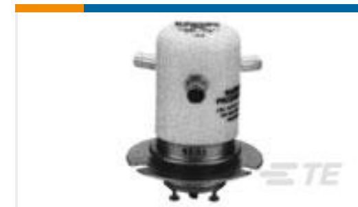
TE 产品编号2-1618278-5 KC-15=RELAY, PRESSURIZED, SPDT