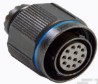
TE 产品编号YDTS26W21-11PNV001 PLUG ASSY