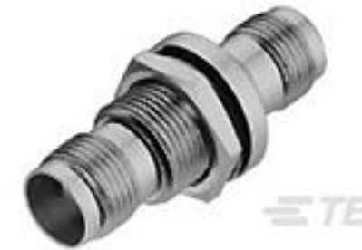
TE 产品编号1-619520-0 JACK TO JACK,ADAPTER,BULKHEAD, TNC