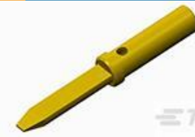
TE 产品编号226335-000 CTA-0166