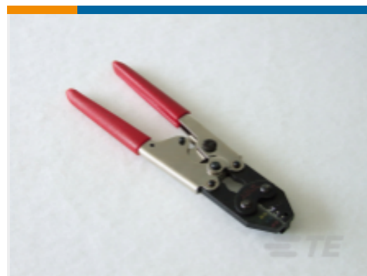
TE 产品编号 992008-000 AD-1377-CRIMP-TOOL-3-CVTY