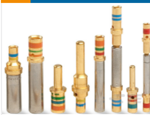
TE 产品编号1662-213-2031 CONT SOC ASSY