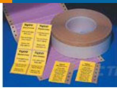
TE 产品编号097370-000 TTVF200YW-100