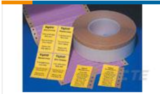
TE 产品编号815438-000 TTVF100YW-100