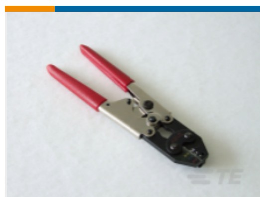
TE 产品编号 992008-000 AD-1377-CRIMP-TOOL-3-CVTY