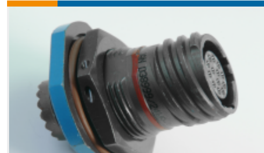
TE 产品编号YACT24MD35PAV00100 JAM NUT RECEPTACLE