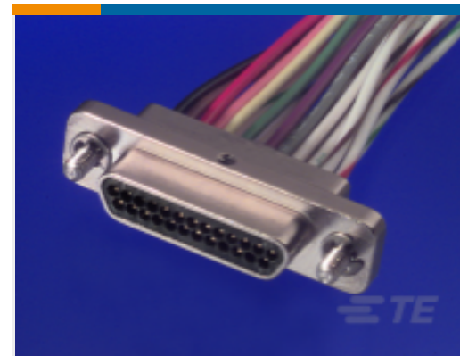
TE 产品编号 2-1532172-7 M83513/04-B11C, MCKS-C2-B-15S6Q9-18.0