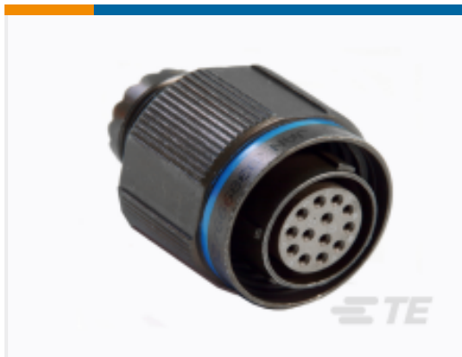
TE 产品编号 YDTS26G21-11SCV001 PLUG ASSY