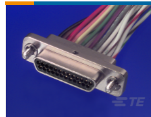
TE 产品编号 2-1532176-7 M83513/04-F11C, MCKS-C2-B-37S6Q9-18.0