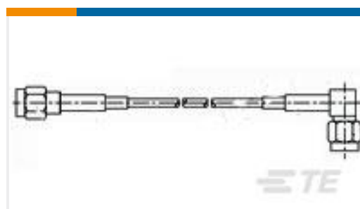
TE 产品编号1337810-1 50 OHM COAX SMA STR PLUG ELB P