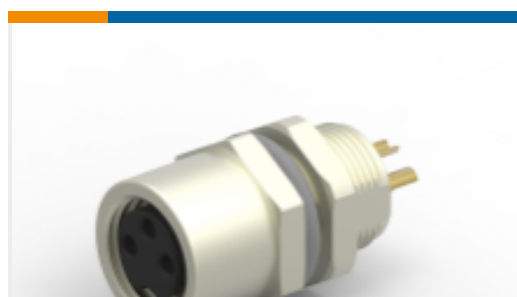
TE 产品编号T4033014031-000 M8.FMLE.PNLFRONT.3POS.STR