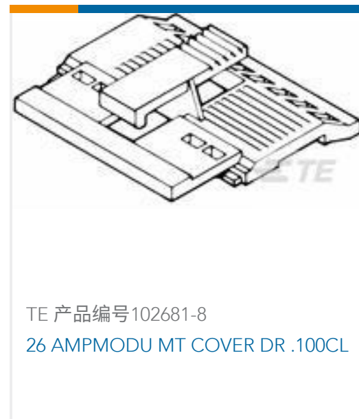
TE 产品编号102681-8 26 AMPMODU MT COVER DR .100CL