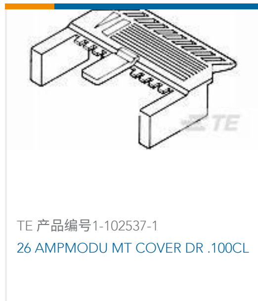
TE 产品编号1-102537-1 26 AMPMODU MT COVER DR .100CL