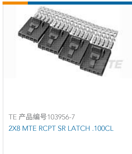
TE 产品编号103956-7 2X8 MTE RCPT SR LATCH .100CL