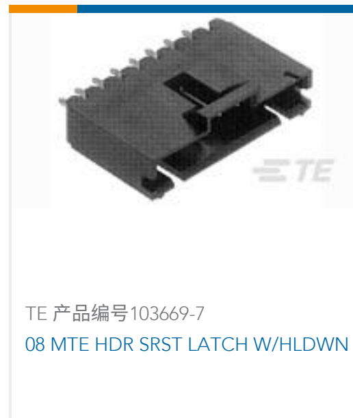
TE 产品编号103669-7 08 MTE HDR SRST LATCH W/HLDWN