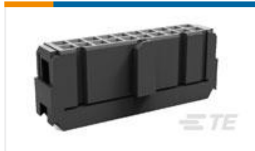
TE 产品编号1658621-2 14 NOVO MIL/CTR 15DP, LEAD FREE