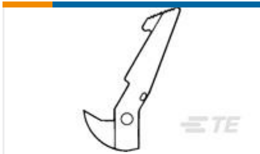
TE 产品编号111338-1 UNIVERSAL HEADER LATCH