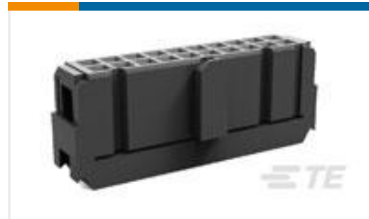
TE 产品编号1658621-9 40 NOVO MIL/CTR 15DP, LEAD FREE