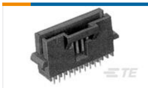
TE 产品编号104071-6 30 SYSTEM 50 HDR SRST SHRD