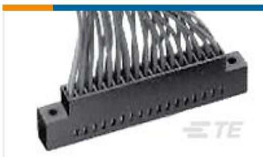
TE 产品编号87483-9 40 MODIV HSG COMP DR .100 EARS