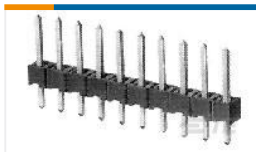
TE 产品编号2-103185-4 24 MODII HDR SRST B/A .100CL