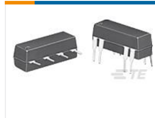
TE 产品编号3-1393771-4 JWS-117-3=REED RELAYS