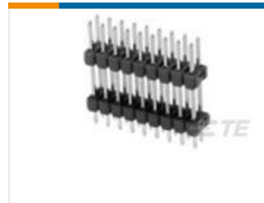
TE 产品编号146507-2 04 MODII HDR DRST UNSHRD STKG