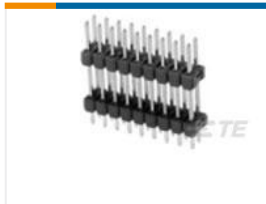
TE 产品编号146507-2 04 MODII HDR DRST UNSHRD STKG