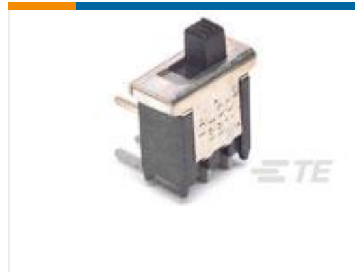
TE 产品编号1571982-2 TSS11DG1PC04=SLIDE SWITCH SPDT