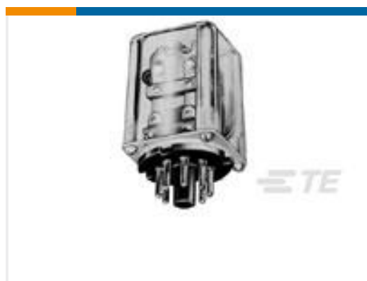
TE 产品编号4-1393100-2 KCP-5-10000=KA/KB/KC/KR