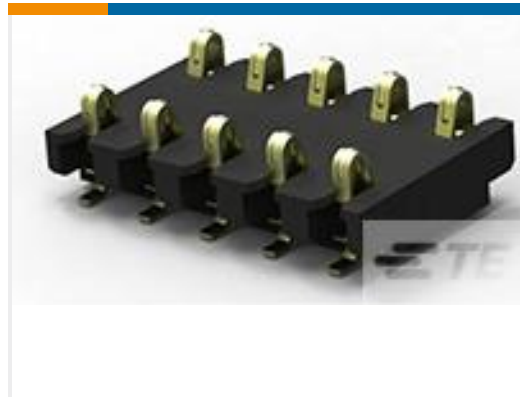
TE 产品编号2199035-2 10 PINS,1.6PICH,1.65H BTOB CONN. 2 ROW