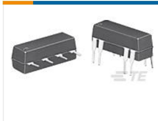
TE 产品编号3-1393771-4 JWS-117-3=REED RELAYS