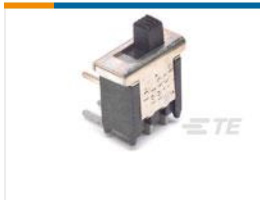
TE 产品编号1571982-4 TSS11EGPC04=SLIDE SWITCH SPDT