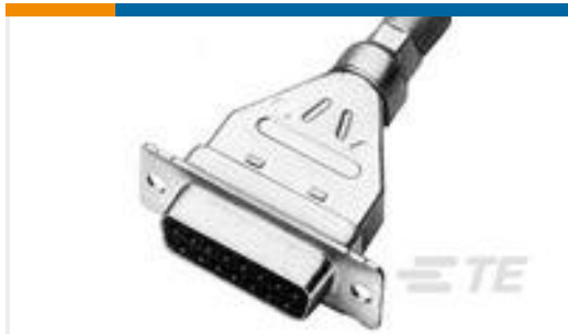
TE 产品编号1658662-1 KIT,HDP-20,OVRMLD,RCPT,SIZE 3,