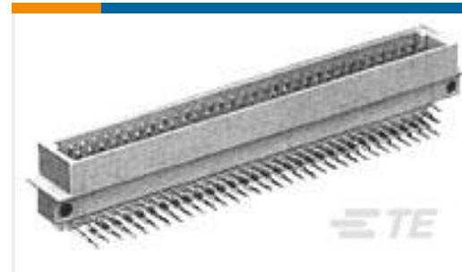
TE 产品编号215605-4 96P.IEC-C MALE CONN