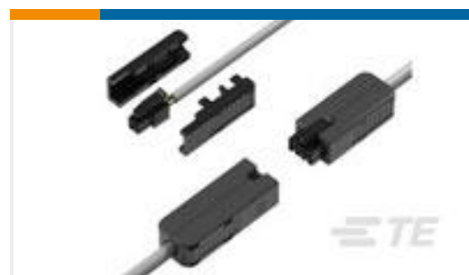
TE 产品编号293736-1 8 pos. coverpart (kit) for P/N 794617-8