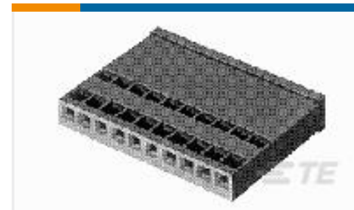
TE 产品编号1-87175-9 09 LOCKING CLIP HSG SR MRKD