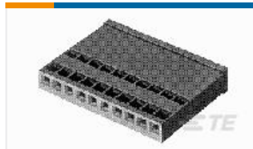
TE 产品编号1-87175-6 07 LOCKING CLIP HSG SR .100CL