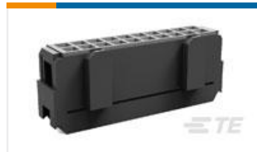
TE 产品编号1658624-2 014 NOVO DUAL 30DP FT