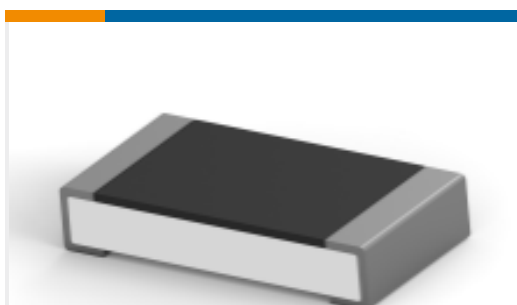
TE 产品编号7-2176388-5 RQ 1206 59R 0.1% 10PPM 5K RL