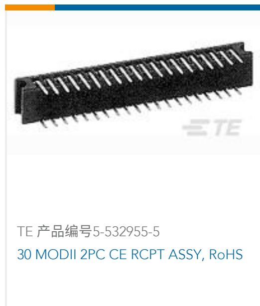
TE 产品编号5-532955-5 30 MODII 2PC CE RCPT ASSY, RoHS