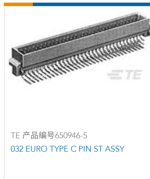
TE 产品编号650946-5 032 EURO TYPE C PIN ST ASSY