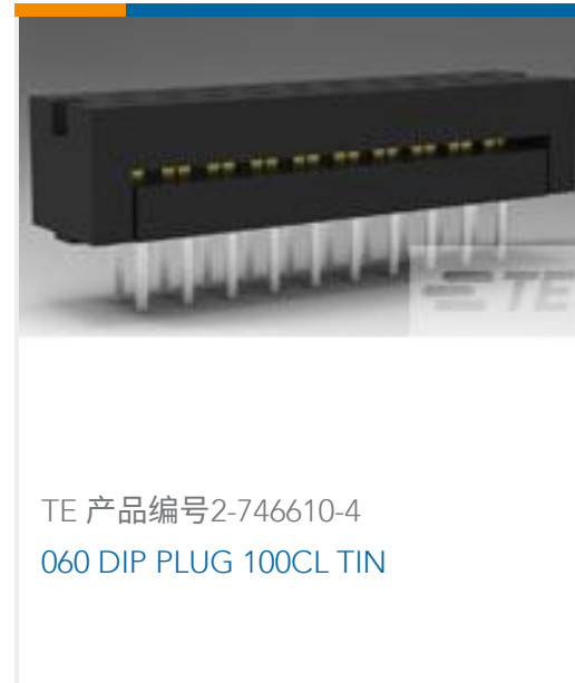
TE 产品编号2-746610-4 060 DIP PLUG 100CL TIN