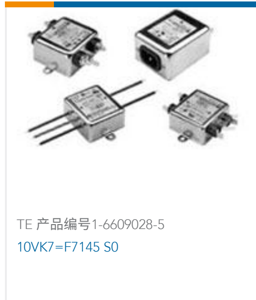
TE 产品编号1-6609028-5 10VK7=F7145 S0