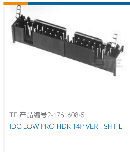
TE 产品编号2-1761608-5 IDC LOW PRO HDR 14P VERT SHT L