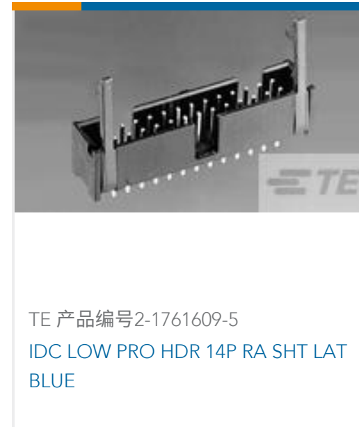
TE 产品编号2-1761609-5 IDC LOW PRO HDR 14P RA SHT LAT BLUE