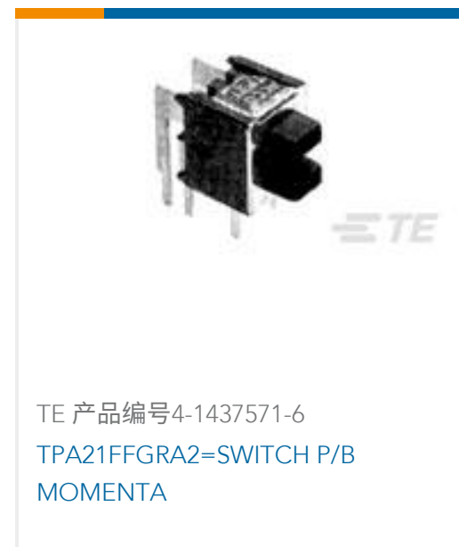
TE 产品编号4-1437571-6 TPA21FFGRA2=SWITCH P/B MOMENTA