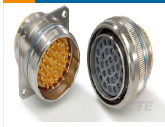
TE 产品编号 ZPF000000000033463 983-OS 22-12 SN-L