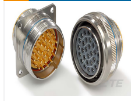
TE 产品编号 ZPF0000000000205035 983-6K 14-04 S6 L