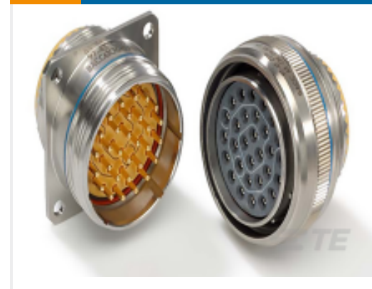
TE 产品编号 ZPF000000000008490 983-6RS 22-12 SN-L