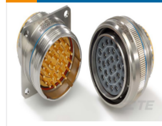
TE 产品编号 ZPF0000000000203745 983-15 K 7-18-08 SN