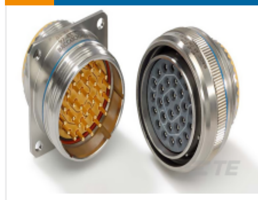
TE 产品编号 ZPF000000000032886 983-ORS 18-08 S9 L