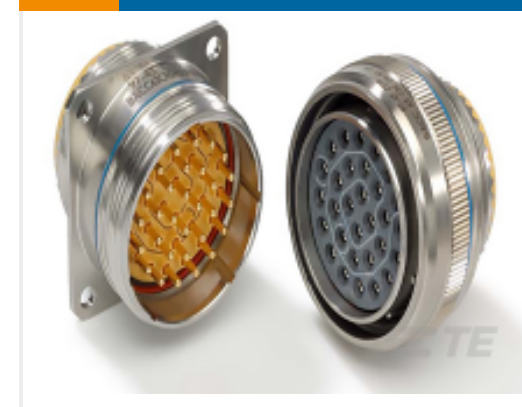
TE 产品编号 ZPF000000000033020 983-ORS 22-12 S6 L