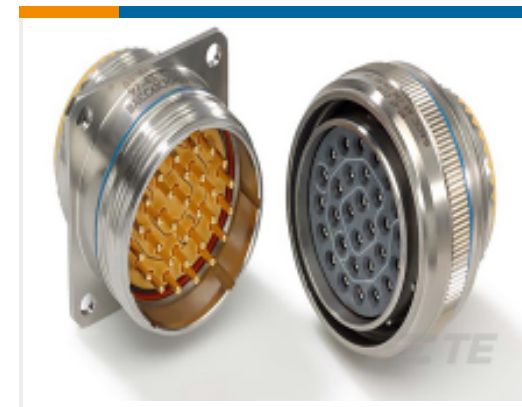
TE 产品编号 ZPF000000000032784 983-ORS 14-04 SN-L