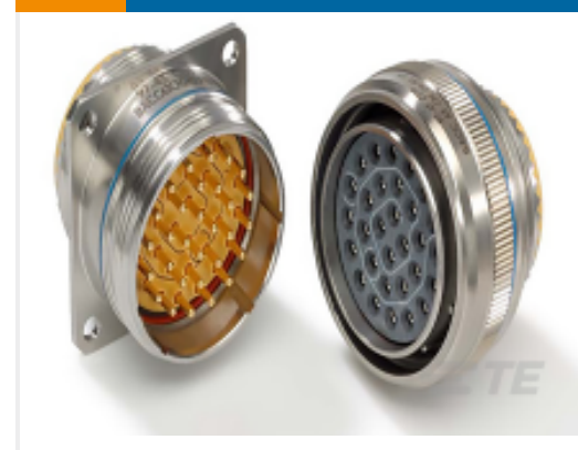
TE 产品编号 ZPF000000000032888 983-ORS 18-08 SN-L