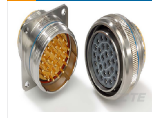
TE 产品编号 ZPF000000000008136 983-6K 18-08 SN-L