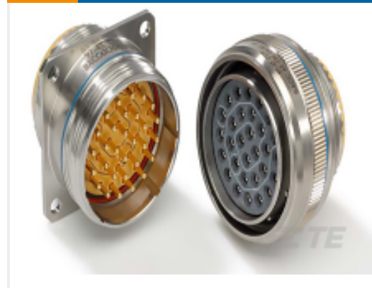
TE 产品编号 ZPF0000000000109186 983-6A 22-12 S7 L