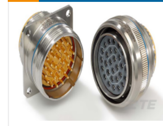
TE 产品编号 ZPF000000000037398 983-6W 14-04 SN-L