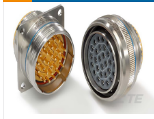
TE 产品编号 ZPF000000000008427 983-6RS 14-04 SN-L