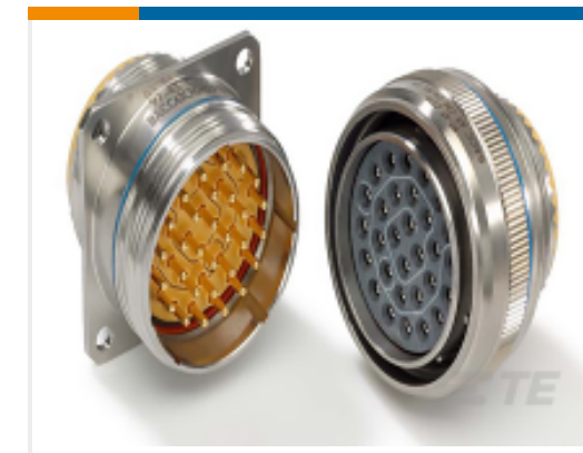
TE 产品编号 ZPF000000000032880 983-ORS 18-08 S6 L