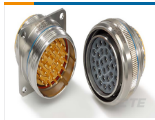
TE 产品编号 ZPF000000000008596 983-6S 14-04 SN-L