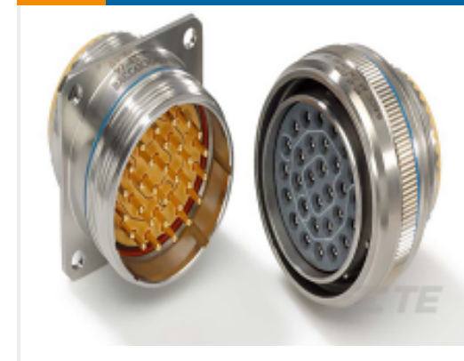
TE 产品编号 ZPF000000000036629 983-6S 18-08 SN-L