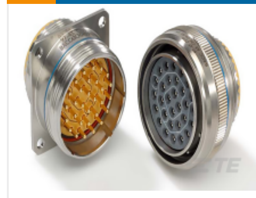
TE 产品编号 ZPF000000000007777 983-OWS 14-04 SN-L