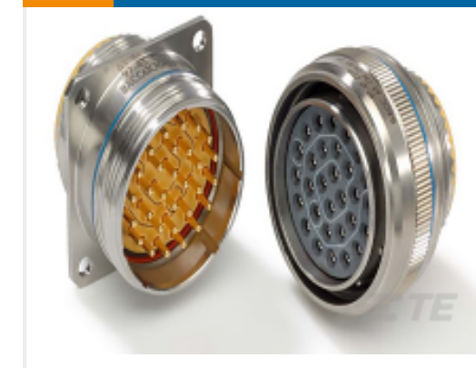
TE 产品编号 ZPF0000000000103533 983-6A 14-04 SN-L