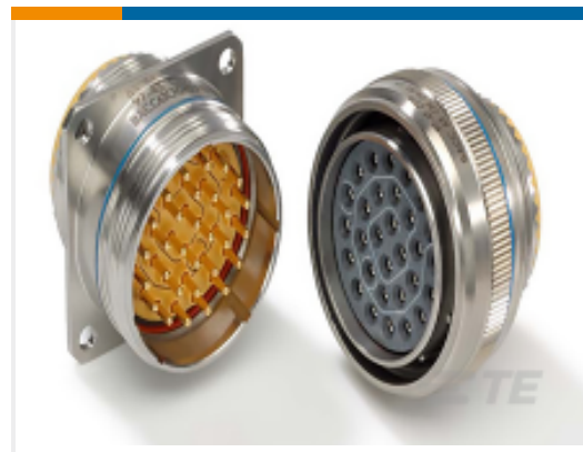
TE 产品编号 ZPF100000000008596 983-6S 14-04 SN-L