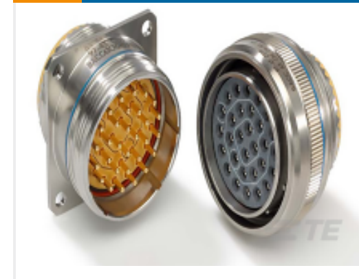
TE 产品编号 ZPF0000000000114772 983-6K 14-04 SN 059