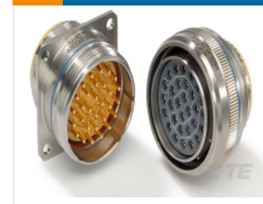
TE 产品编号 ZPF000000000007368 983-OS 14-04 SN-L