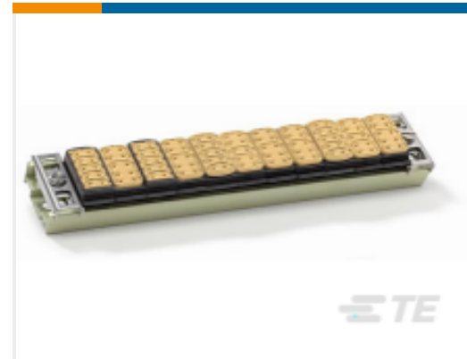
TE 产品编号ZPF0000000000020131 FMJ 11E 12-02 K