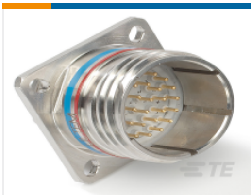
TE 产品编号DTS20F25-19PN RECP ASSY