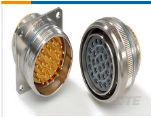
TE 产品编号ZPF000000000007442 983-0S 22-55 PN-L