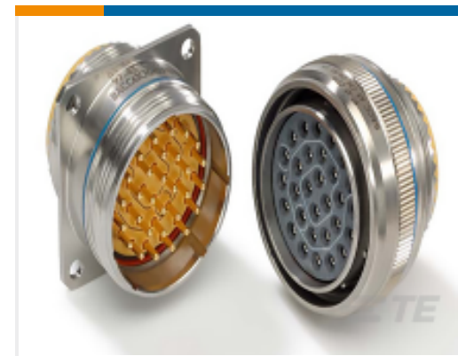
TE 产品编号ZPF000000000007306 983-0S 08-03 P8 L