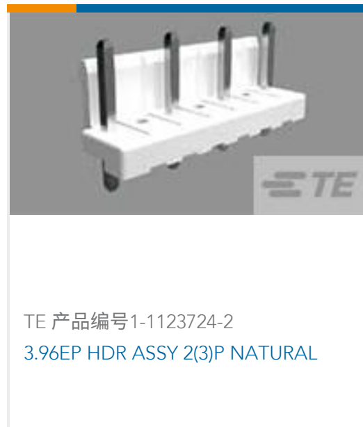
TE 产品编号1-1123724-2 3.96EP HDR ASSY 2(3)P NATURAL