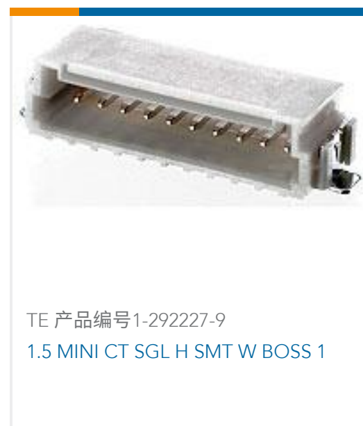
TE 产品编号1-292227-9 1.5 MINI CT SGL H SMT W BOSS 1