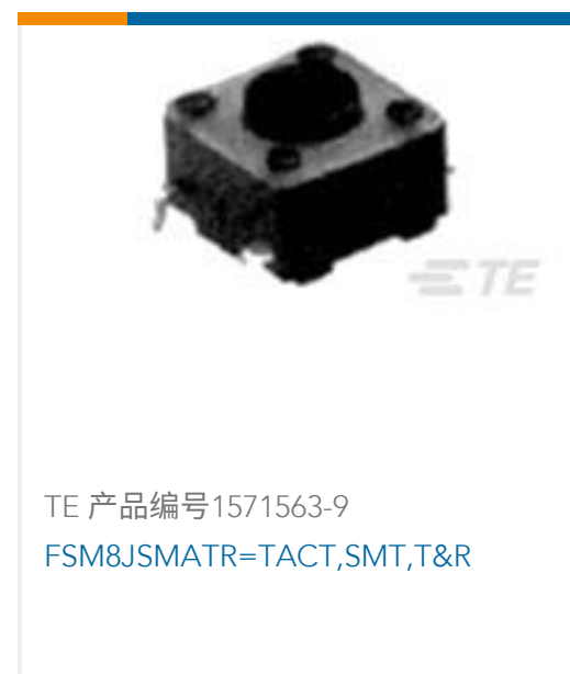
TE 产品编号1571563-9 FSM8JSMATR=TACT,SMT,T&R