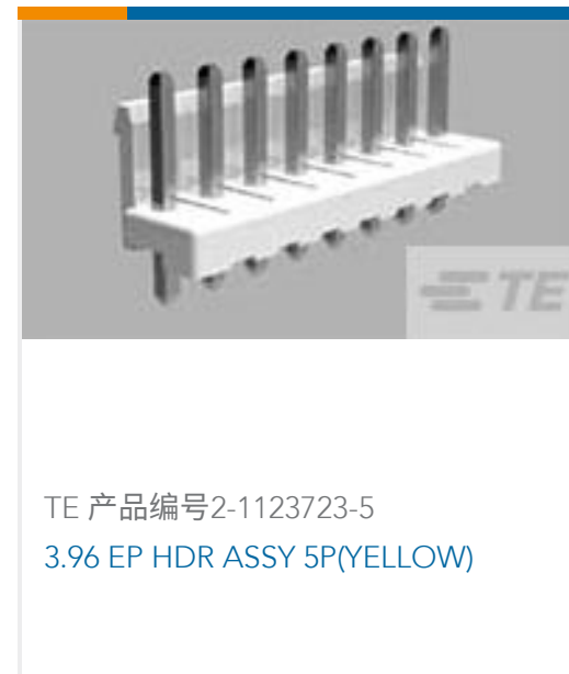
TE 产品编号2-1123723-5 3.96 EP HDR ASSY 5P(YELLOW)