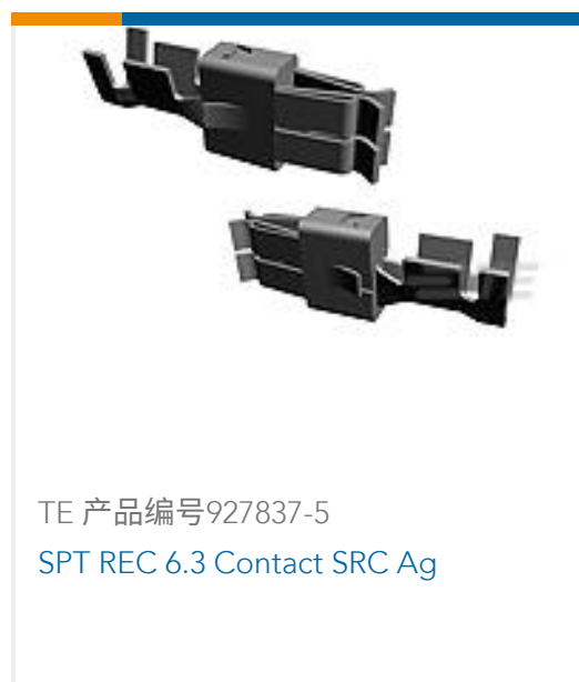
TE 产品编号927837-5 SPT REC 6.3 Contact SRC Ag