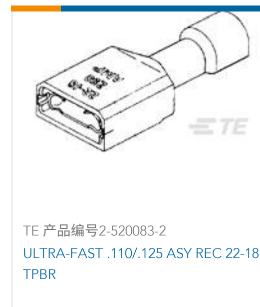
TE 产品编号2-520083-2 ULTRA-FAST .110/.125 ASY REC 22-18 TPBR