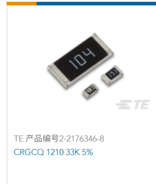
TE 产品编号2-2176346-8 CRGCQ 1210 33K 5%