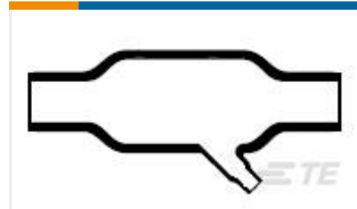
TE 产品编号638705-000 342A012-4/86-0