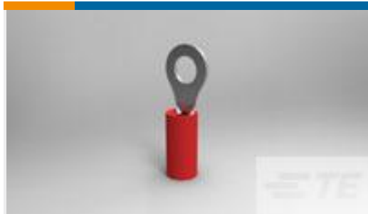
TE 产品编号32835 PIDG R 22-16 COMM 22-18 MIL 8