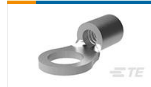
TE 产品编号8-34104-1 SOLIS R 22-16 COMM 22-18 MIL 4