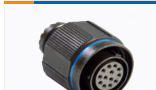
TE 产品编号YDTS26T11-98PDV001 PLUG ASSY