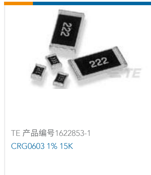
TE 产品编号1622853-1 CRG0603 1% 15K