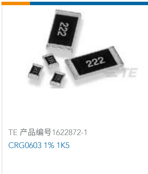
TE 产品编号1622872-1 CRG0603 1% 1K5