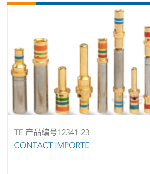
TE 产品编号12341-23 CONTACT IMPORTE